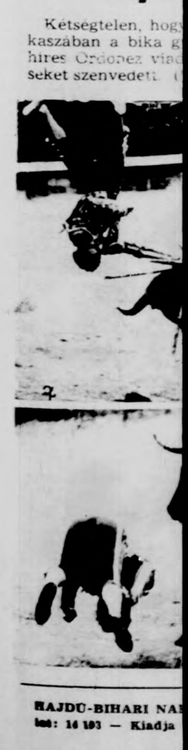
Hajdu-Bihari Napló: 16. 193 - Kiadja

Kétségtelen, hogy Kaszaban a bika híres Ordonez viték seket szenvedett.