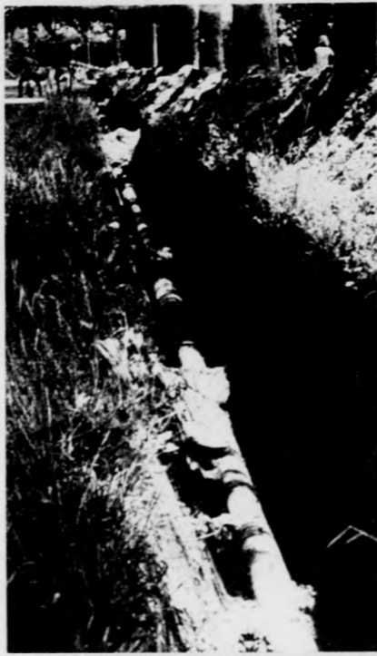
ÁROK IS VAN, GÖDÖR IS VAN... A NAGYERDEI KÖRÚT MENTÉN