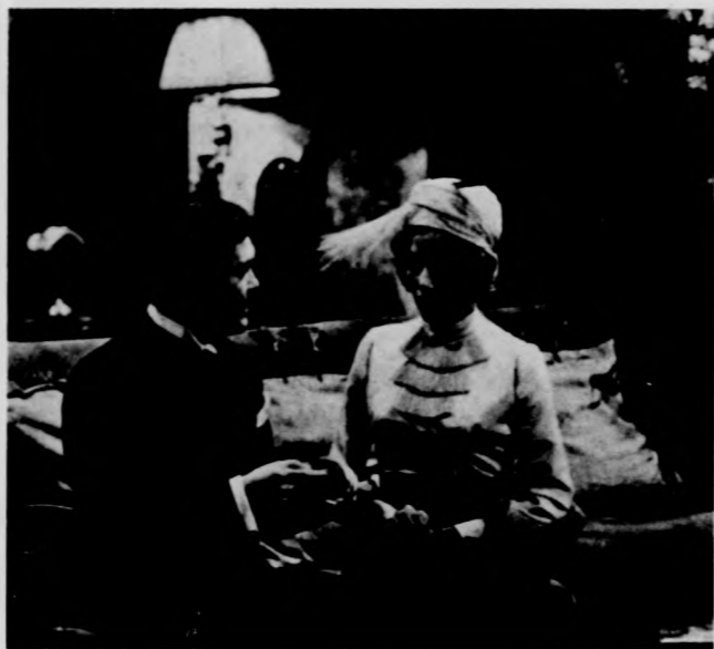
Jelenet „A doverti út” című tv-komédiából. (A tv június 19-i műsora.)