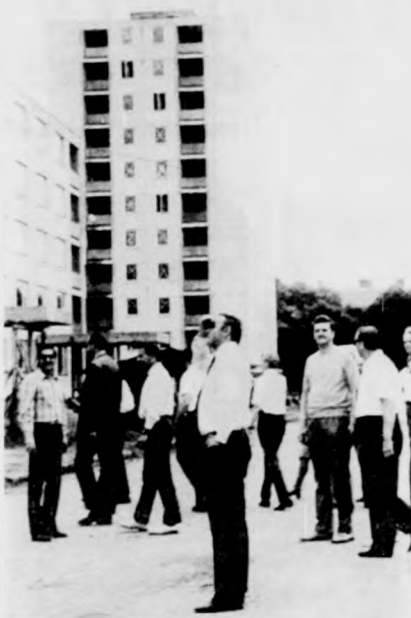
Az elnökség tagjai a Kandia utcai házgyári lakótelepnél

Csütörtökön Debrecenbe érkezett az Építőipari Tudományos Egyesület Országos Elnökségének 42 tagja, hogy a jól működő debreceni csoport vendégeként itt tartsák meg kétnapos, rendezt ülést. Az elnökség tagjait dr. Letényi Árpád, az ÉTE debreceni regionális csoportjának elnöke fogadta és üdvözölte, majd a délutáni órákban Hajdúszoboszlón tekintették meg a fürdőváros nevezetességeit, építészeti jellegzetességeit. A pénteki program keretében a Debreceni Házgyárba látogattak el a vendégek és vendéglátók, majd megtekintették a házgyári panelekből készült új házakat a Béke-Kandia utcai építkezésnél. Városnéző programjuk színtere volt még a Kossuth Lajos Tudományegyetem új kémiai épülete, az Új Vigadó, a Barna utcai turisztaszálló és az épülő 22 emeletes toronyház.