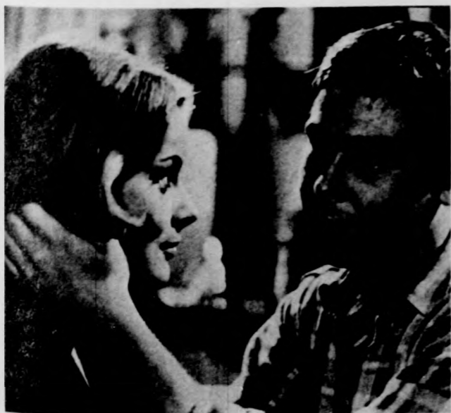
Jelenet a „Barbara New Yorkban” című nyugatnémet filmből. (A tv június 16-i műsora.)

3.33 Kis emberek, nagy emberek. Az Intervízió gyermekműsora Berlinből. 11.00 V. Országos Utóóratalálkozó — Hetiműködés kamara. 11.25 Úszni tudni kell. I. rész. 11.45 Amerikai komédiák. II. rész: Hajszá az orzsi. (ism.). 15.23 Gorri az őrdög. II. rész. 15.55 A vadon törvényei. 6. Impallák és páviánok. 16.20 Prizma. 16.55 Műsorainkat ajánljuk! 17.25 Telesport. Bp. Honvéd—Vasas bajnoki labdarúgó-mérkőzés. Sport hírek. 19.20 Esti mese. 19.30 A „Her”. 20.30 Hírek. 20.35 A Forsyte Saga. 24. rész: Délután Ascorban. 21.30 Húszezer mérföld szárazon és vízen... VII. rész: A vikingek nyomában. 22.05 Az érem harmadik oldala... 22.15 Hírek. 22.20 Telesport. Súlyemelő EB és Sport hírek.