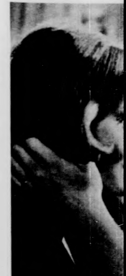
Jelenet a „Ba nyugatnémet filmből

9.38 Kis emberek, na, linból, 11.00 V. Orsz. 11.25 Uszni tudni kell, sza az órárt, (ism.) 1. yvényei 6. Impallak 1. ajánljuk! 17.25 Telesp. közés, Sporthírek, 15. 20.35 A Forsyte Saga mérföld száron, és 22.05 Az érem harmad. emelő EB és Sporthire