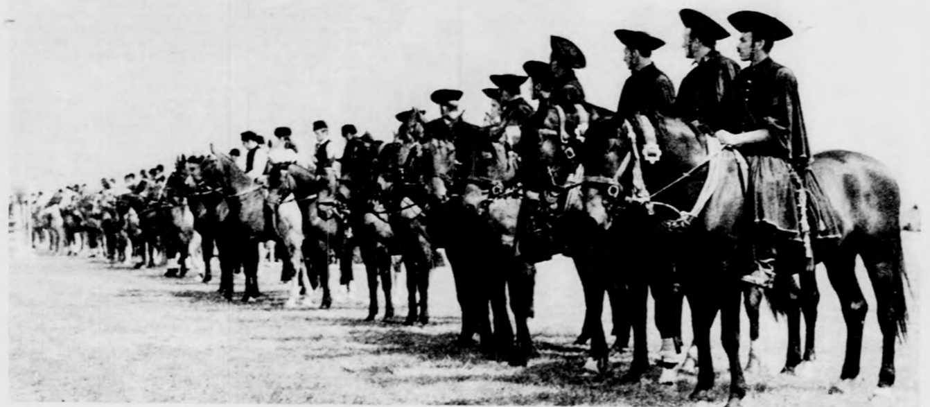
A hazai és a külföldi lovasok a záróünnepségen