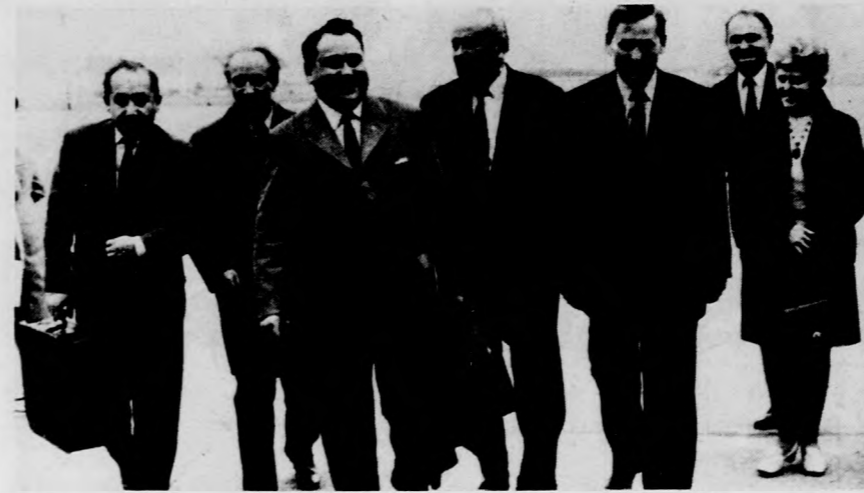
MOSZKVA. Az SZKP küldöttsége Leonid Breznyev vezetésével Berlinből visszaérkezett Moszkvába.

Az űrállomás rendszerei szabályszerűen működnek, az űrhajósok közérzete jó. (TASZSZ)