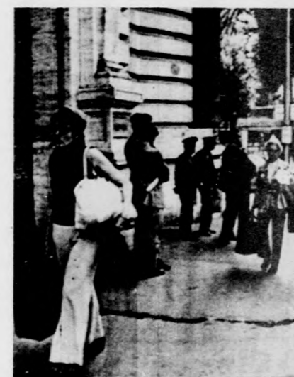
Csaknem negyedmillió hotelalkalmozott lépett sztrájkba Itáliában az idegenforgalmi főszezon kezdetén. Képünkön: a szállodavendégek a sztrájk miatt maguk viszik csomagjaikat Firenzében.