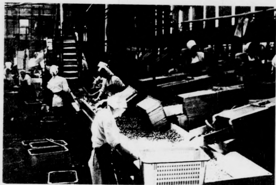
A Debreceni Konzervgyárban a cseresznyeszezon közepén járnak. Képünkön a „cseresznyevonal” eleje, ahol a szárítópó gépekről a szalagra kerül a gyümölcs.

ALMALÉ-KÜLÖNLEGESSÉGET állítottak elő a Konzerv- és Paprikaipari Kutatóintézetben. Jonathanból és hüvelyes rozmaringból természetes ízű, a fajta jellegzetes zamát megtartó üdítőt készítettek, amely semmilyen idegen anyagot nem tartalmaz, s megőrzi a gyümölcs vitamin- és árványianyagtartalmát.