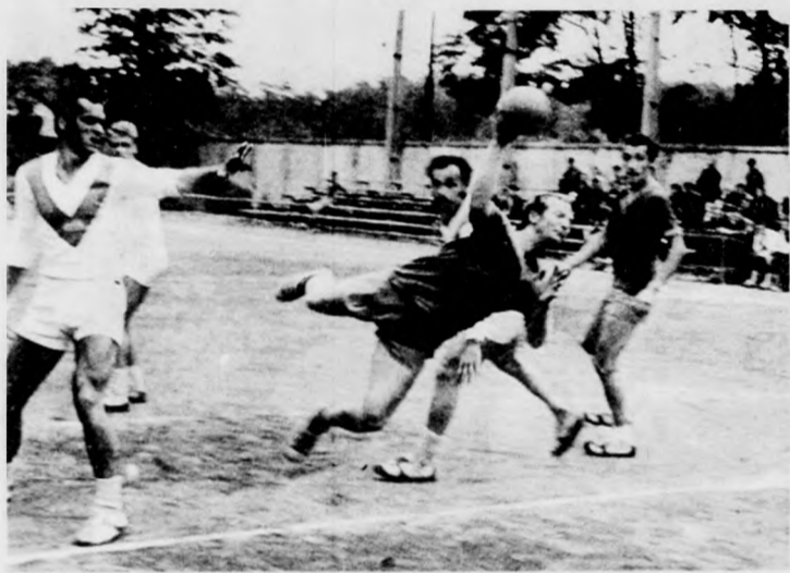
Illéssy (MGM) kiugrott a védőfalból és lövése nyomán a hálóban kötött ki a labda

A kézilabda NB II-ben helyi rangadót játszott a DVSC és a D. Közútepitők női csapata. A mérkőzést — nagy küzdelemben — a DVSC nyerte, és megérdemelt vezető helyét a bajnoki táblázaton. A férfiaknál az MGM Vasas itthon nehezen nyert, a D. Építők otthonában egygólos vereséget szenvedett.