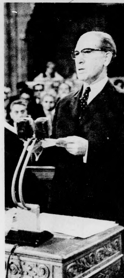
poló szocialista gazdasági integráció.

Kormányunk iránymutatónak tekintti a párt X. kongresszusának megállapítását, amely szerint a Magyar Népköztársaság teljes mértékben támogatja a KGST-országok arra irányuló törekvését, hogy minél sokoldalúbban valósuljon meg az önálló nemzetgazdaságokon ala-