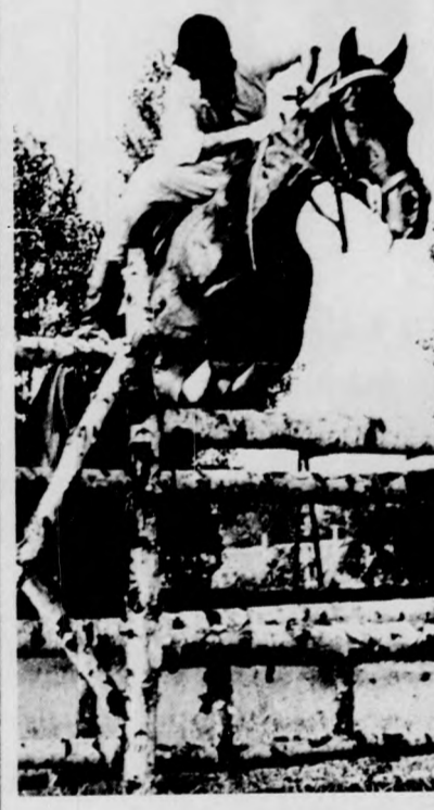
Lovas és ló az akadály felett