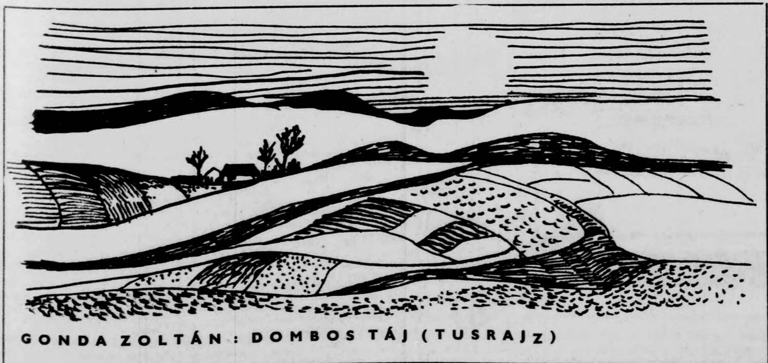
GONDA ZOLTÁN: DOMBOSTÁJ (TUSRAJZ)