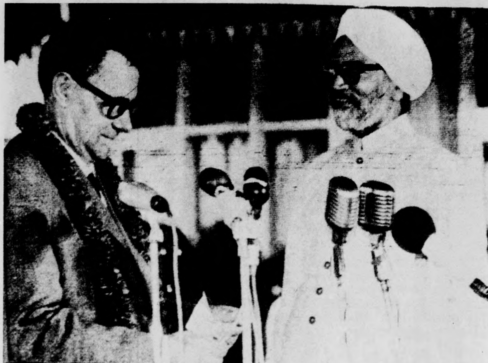
Gromiko szovjet külügyminiszter az indiai kormány meghívására vasárnap hivatalos látogatásra Új-Delhibe érkezett. A magas rangú szovjet vendéget a repülőtéren Szvaran Szingh indiai külügyminiszter fogadta.

Szingh beszámolójában hangsúlyozta, hogy a szerződés nem irányul harmadik ország ellen. „Valójában azt reméljük, hogy a szerződés mintául szolgálhat India és a térség más országai között kötéendő hasonló egyezményekhez” — fűzte hozzá. „Az ilyen szerződések e térség országai között csak erősíthetnek a békét és az érintettek függetlenségét és szuverenitását.”