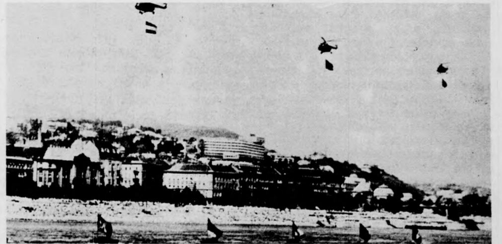
Alkotmányunk születésének 22. évfordulóján Budapesten a Magyar Honvédelmi Szövetség és a Néphadsereg mutatott be vízi- és légi parádét.

Vannak az új szabályzatban könnyítő rendelkezések is. Egy pont például elsősorban a gyermekes anyák érdekében született. Eszerint egyéni elbírálás alapján nem tekintik megszakítotttnak a munkaviszonyát annak, aki kilépett ugyan, de két éven belül visszatért a vállalathoz. (Például a gyermekgondozási segély bevezetése előtt gyakran megtörtént, hogy a kisgyermekes anyának egy időre otthon kellett maradnia a gyerek nevelése érdekében, s ezért meg kellett szakítania munkaviszonyát.) Ugyancsak intézkedik a szabályzat azok szolgálati idejének rendezéséről, akik gyermekgondozási segélyben részesülnek, katonai szolgálatra vonultak be, vagy államközi megállapodás alapján külföldön vállaltak munkát.