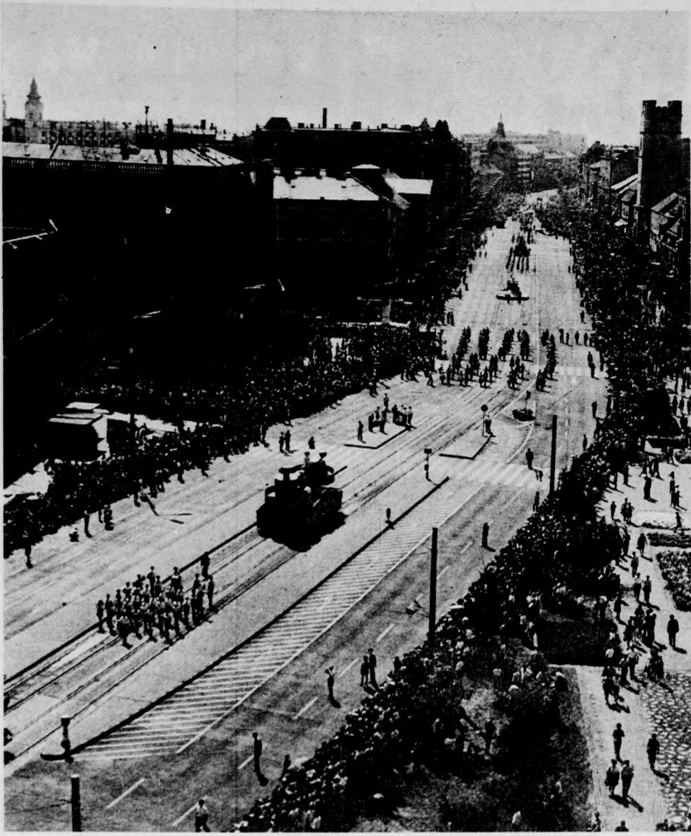
Tizezrek a főtcán

Pontosan kilenc órakor egy helikopter jelent meg a város felett, s virágosóval köszöntötte az ünneplő debrecenieket, majd megszóltak a nyitókocsi harsonái, és kezdetét vette a VI. országos debreceni virágkarnevál színpompás menete. Hu-