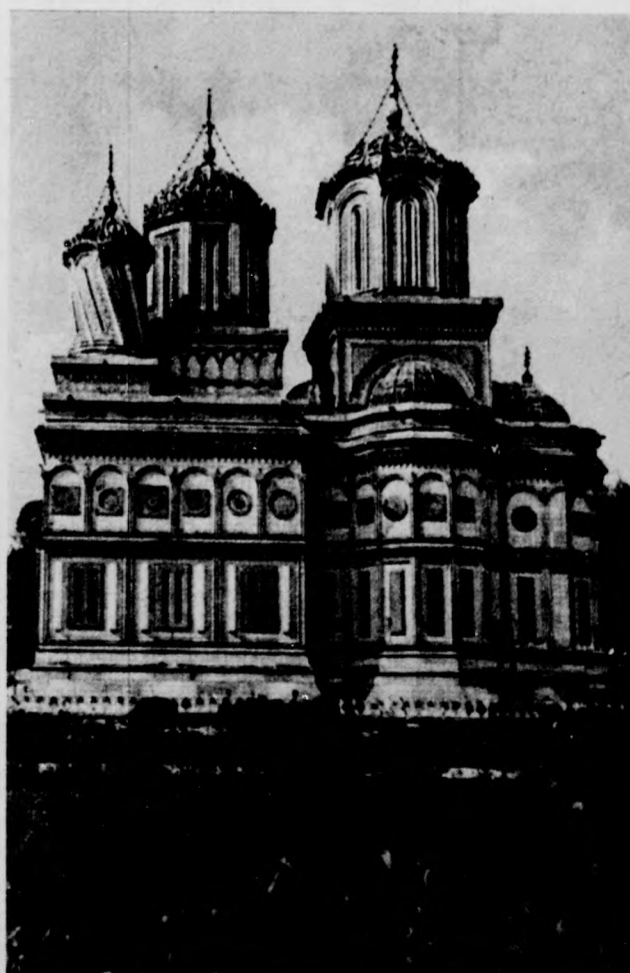
A gátépítő utódok ősei építették a csodálatosan szép székesegyházat Curtea de Argesben