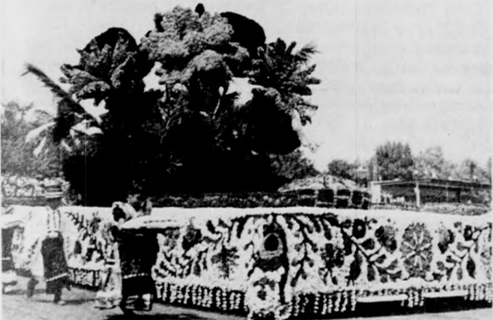
A miskolci nagydíjas kompozíciója