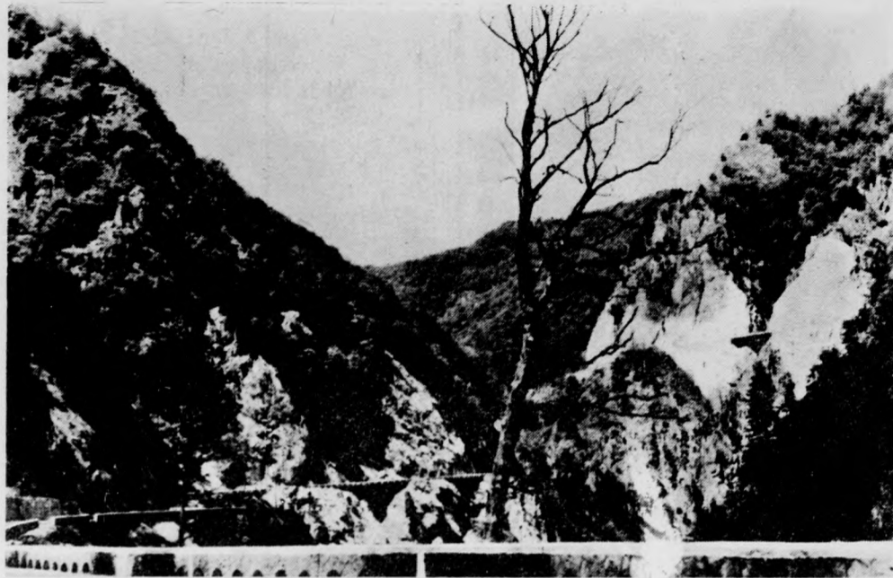
A serpentinek alatt, a hegyek gombrában van az erőmű