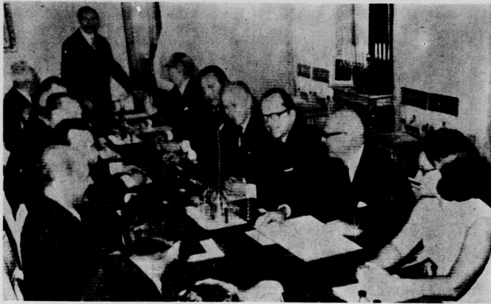
A magyar- finn államfői tárgyalások Losonczy Pállal szemben: Urho Kekkonen elnök.

A nemzetközi helyzetről folytatott eszmecsere során a felek megelégedéssel állapították meg, hogy nézeteik hasonlóak.