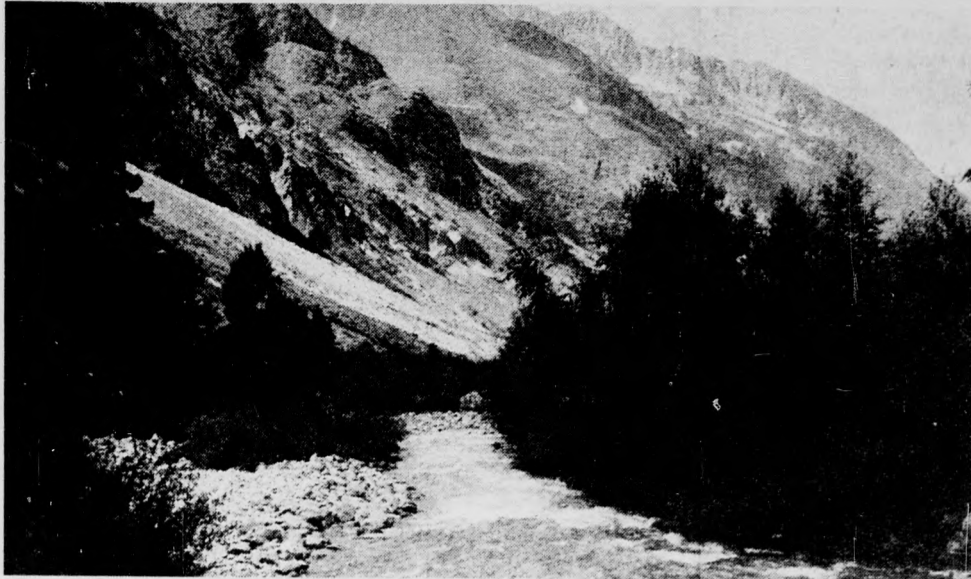
Hegyek, folyó, fák = Alpok

Bizonyára nem véletlen, hogy három alkalommal is jártunk pezsgógyárban. Egy kis magánüzemben, továbbá a Beauen-i bormúzeumban és a Ricardo művek dijoni gyűjteményében. Számomra a legérdekesebb a kisüzem volt. Arisztokrata külsejű gazdájával, aki szinte minden érő üveget ismert, s olyan bensőséges szeretettel magyarázta