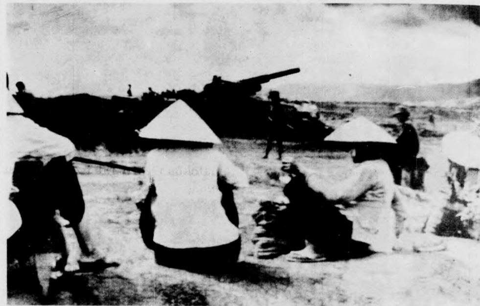
Szomorú felvétel Dél-Vietnamból: pihenő parasztok Mai Loc térségében, egy dél-vietnami nehézüteg szomszédságában.