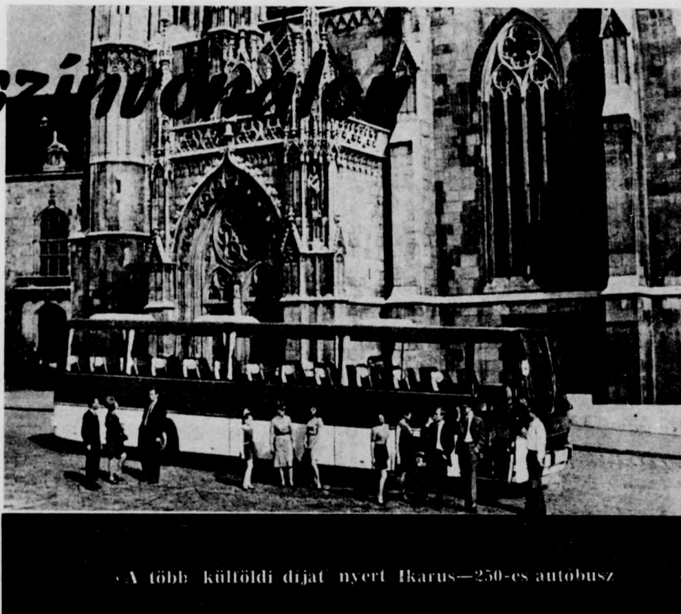
A többi külföldi díjat nyert Ikarus-250-es autóbusz

felsorakozott a legjobbak mellé, világmárka lett.