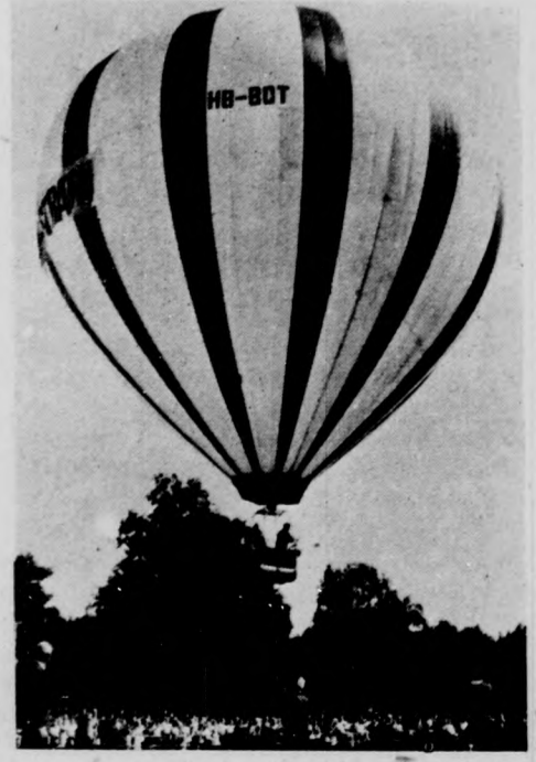
A 44. bélyegnap és a nemzetközi bélyegkiállítás alkalmából vasárnap délután a budapesti Városligetből 15 méter átmérőjű ballon emelkedett a magasba két léghajóval és két zsák levelel a fedélzetén. A nem mindennapos postajarat egy órával később Csömör határában ért földet.

Nagy örömet szerez a vágottak értékelése azoknak, akik már albumukban őrzik e különlegességeket: 1963. Rózsaké-állítás 10 (7,5), 1968. In memoriam blokk 60 (50), 1968. Apollo-11 blokk 75 (55), 1969. Rembrandt 6 (3), 1970. Meteorológia 5 (2) frank.