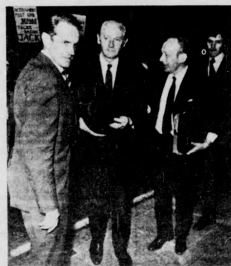
Írország londoni nagykövetsége előtt hatalmas tüntetés zajlott le Jack Lynch ír miniszterelnök londoni tárgyalása alkalmából. Képünkön: (középen) Lynch a londoni ír nagykövetség előtt, kísérők védik a tüntetőktől.

A küldöttséget délután fogadta Msztyiszlav Keldis akadémikus, a Szovjetunió Tudományos Akadémiájának elnöke.