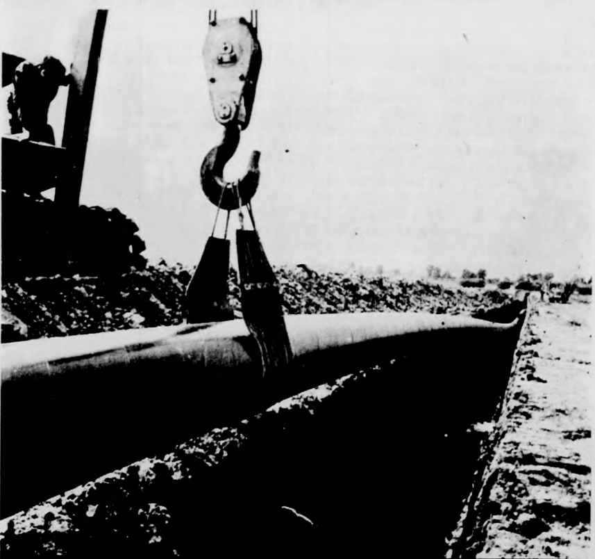
A Barátság II. olajvezeték építése jelentős állomáshoz érkezett. Lenínváros közelében az építők elérték a Tiszát. A folyó bal partján földbe helyezik a szigetelt csöveket, a jobb parton hegesztik és ellenőrzik a csöveket, a Tiszában kotorják a medret az új csövezetéknek.