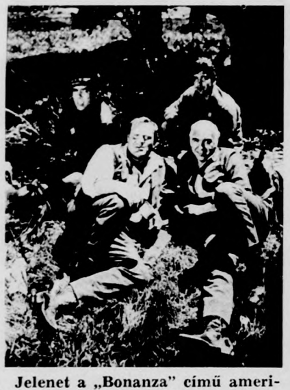
Jelenet a „Bonanza” című amerikai kalandfilmből. (A tv október 9-i, szombati műsora.)