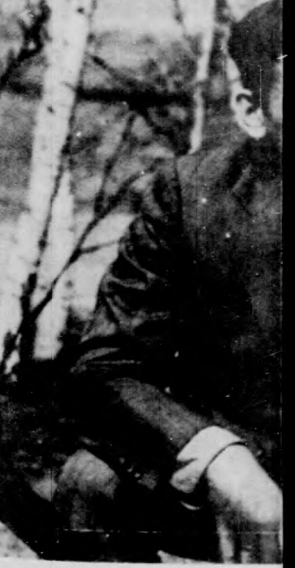
Jelenet a „Hans Beimler”-ből. (A tv október 9-i, sz.)

8.00 Iskola-tv. Felsőfokú r. laddóknak. 9.05. Francia ny. rész. 10.00 Ferencváros—B. közés. 11.05 Hétfőműködés. az Úttörőzenekarok Ország. Országos Találkozójának sz. rü pedagógia műhelyéből. Róplabda Európa-bajnokság. anyám sok szép szava... 17.30 Delta. 18.05 Magilla. mese. 19.00 A „HET”. 20.00. Telesport: Lengyelország— zés köztitése, felvételről. hírek.