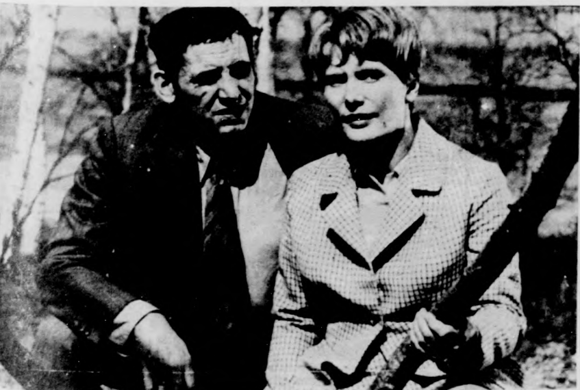
Jelenet a „Hans Beimler bajtárs” című NDK tv-filmsorozat I. részéből. (A tv október 9-i, szombati műsora)

8.00 Iskola-tv. Felsőfokú matematika, 8.40 Orosz nyelvtanfolyam haladóknak, 9.05 Francia nyelvtanfolyam haladóknak, 9.30 Flipper, 3. rész, 10.00 Ferencváros-Bakony Vegyész női bajnoki kézilabda-mérkőzés, 11.05 Hétfői birodalom, 11.20 Fényrehab, II. rész: Részlet az Úttörőzenekarok Országos Fesztiváljának esti és Éneklő Rajok Országos Találkozójának szentesi díszhangversenyéről, 14.38 A korszerű pedagógia műhelyéből, 15.15 Emberek és emberké, (ism.) 16.05 Röpplabda Európa-bajnokság Olaszországban, Riportműsor, 16.40 „Edes anyam sok szép szava...” Népdalműsor, 17.05 Műsorainkat ajánljuk! 17.30 Delta, 18.05 Magilla gorilla, 2. rész, 18.30 Sportfrók, 18.40 Esti mese, 19.00 A „HÉT”, 20.00 Hírek, 20.05 Rózsa Sándor, VIII. rész, 21.05 Telesport: Lengyelország-NSZK Európa-bajnoki labdarúgó-mérkőzés közvetítése, felvételről, 21.45 Kicsoda? Kicsoda? 22.35 Hírek, sport-hírek.