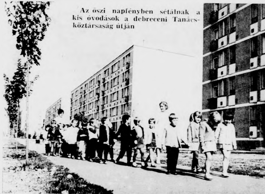
Az őszi napfényben sétálnak a kis óvodások a debreceni Tanácsköztársaság útján

A zártkertek sorát három új zártkert kialakításával növelték, és ezzel a pallagi körzetben az apafai részen is alakultak zártkertek a már meglévő szőlő és gyümölcsös területen. Az összesen 66 zártkertben hétezer debreceni lakosnak van kertje, 400 vagy 200 négyzetméteres parcellákban. Érdemes megemlíteni, hogy a zártkertrendezés során minden problémát megoldottak tárgyalások útján. Néhány zártkertenél már a terület körülkerítését is megoldották, és kapuval látták el a tulajdonosok.