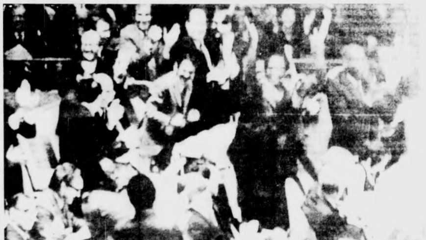
A kínai ENSZ-szavazás után a közgyűlési delegátusok többsége helyről felugorva, tapsolva adott kifejezést a Kínai Népköztársaság jogainak helyreállítása feletti örömeinek.

Magyar idő szerint kedden hajnali 4.20 órakor Adam Malik, az ENSZ-közügylés 26. ülészakának elnöke nagy ováció közepette kihirdette: 76 szavazattal 35 ellenében, 17 tartózkodással a közgyűlés jóváhagyta az úgynevezett albán határozati javaslatot, amely előírja a Kínai Népköztársaság ENSZ-jogainak helyreállítását és a Csang Kai-sek rezsim képviselőinek haladéktalan eltávolítását az ENSZ összes szerveiből. Malik egyidejűleg bejelentette, hogy a közgyűlés döntéséről tájékoztatják a Kínai Népköztársaság kormányát.