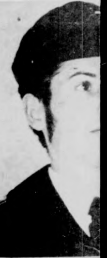
HALÁSZ Z SZABÓ Z