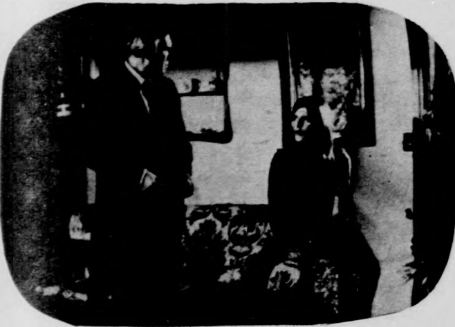
A „Coralba” című olasz bűnügyi filmsorozat I. része (Február 17., csütörtök)

8.00 Miska bácsi lemezeisládája 8.30 A Magyar Rádió és Televízió gyermekkorosa Bárdos Lajos műveket énekel 8.40 Mezők, falvak éneke... 9.00 Magyar művészek operahangversenye 10.00 Jegyzet 10.10 Mit hallunk? 10.40 Szívesen hallgattuk: Vasárnapi koktél (ism.) 12.10 Jó ebedhez szól a nóta 13.05 Orroska. Mesejáték (ism.) 15.00 Jelenidőben. III. évfolyam 2. szám 15.30 Sláger volt, hallgassuk meg újra! 16.05 Patachich Iván szerzeményeiből 16.35 A vasárnap sportja 17.05 Magyarország 1514-ben. II. rész 17.52 Mario Lanza filmdalokat énekel 18.05 Közvetítés az országos asztalitenisz-bajnokságról 18.15 Tudja Ön, hol van a Terecseny-pusztá? 18.45 Népdalcsokor 19.17 Mikrofon előtt az irodalmi szerk. hangversenye 19.35 A Magyar Kamarazenekar hangversenye Kb. 20.50 Versek Kb. 20.55 A hangverseny-közvetítés folytatása Kb. 21.30 Könyvek és századok Kb. 21.55 Operett-részletek