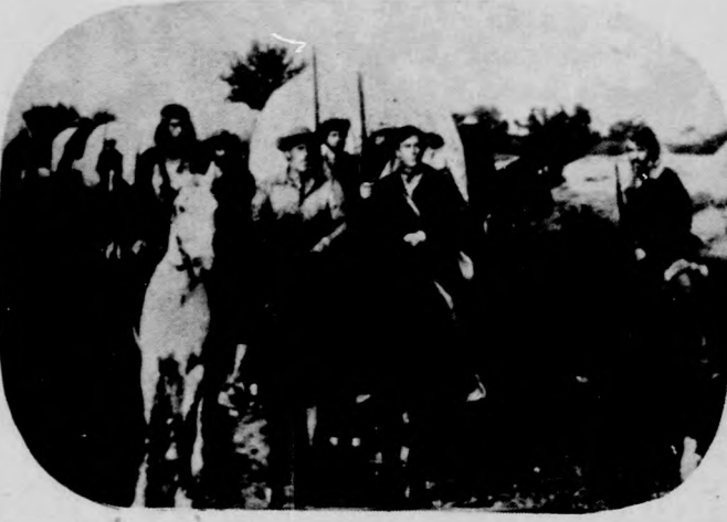
„Az utolsó mohikán” című film (Február 20., vasárnap)

MINDENRŐL tájékoztat a HAJDÚ-BIHARI NAPLÓ