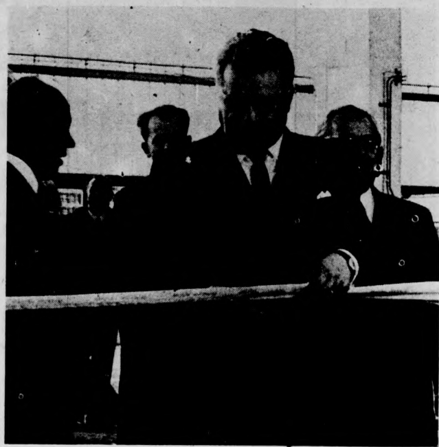
A Debreceni Házgyár felavatása

A Napló olvasói talán még emlékeznek az itt közölt képre. (Napló 1971. április 14.) A felvétel a Debreceni Házgyár ünnepélyes átadásakor készült, amikor Bondor József építészeti és városfejlesztési miniszter átvágta a szalagot, s ezzel átadta rendeltetésének Debrecen egyik legnagyobb létesítményét. Azóta még egy év sem telt el, de máris szemünk előtt magasodnak az új gyár termékei, a házgyári lakóházak. Egy új házgyári lakótelep látványának is érdekesebb. Az sem véletlen, hogy az új lakóházak és lakások — mint minden új — nagy érdeklődést váltanak ki városunkban. Ezt az érdeklődést kíséreljük meg kielégíteni, amikor cikksorozat keretében ismertetjük meg olvasóinkkal a terveket, építkezéseket és válaszolunk a leggyakrabban felmerülő problémákra. A tervezők igyekeznek majd választ adni általános és részletes kérdésekre is. Tájékoztatónk az eddig végzett munkáról, a jelen feladatairól és a közeljövőben sorra kerülő lakásépítkezésekről.