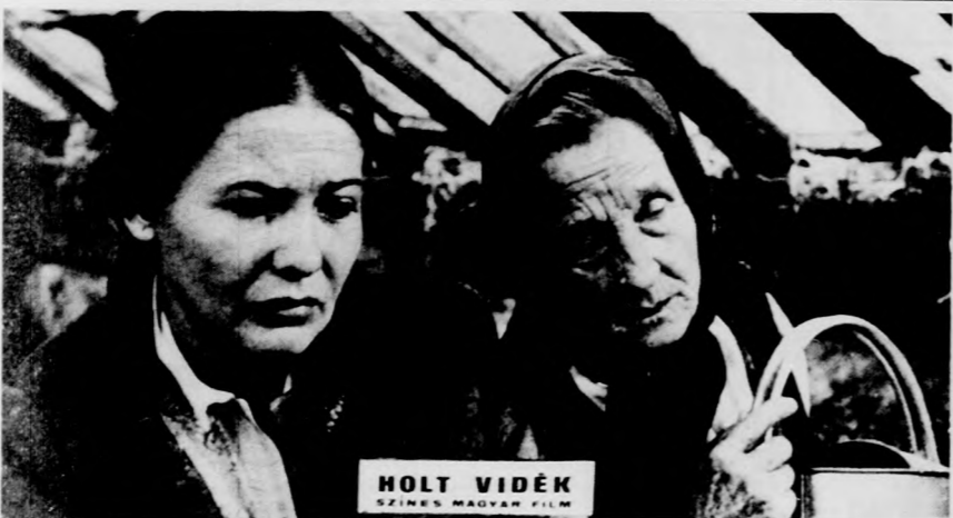
A HÉT FILMJEI

A debreceni Vig moziban április 6-tól 9-ig a „Vidékiek New Yorkban” című színes, szinkronizált amerikai filmvígjátékot, április 10-től 12-ig a Holt vidék című színes új magyar filmet mutatják be a délutáni előadásokon. Az Apolló moziban április 6-tól 9-ig a Holt vidék című magyar film szerepel a délutáni előadások műsorán, este 8 órakor pedig „A völgy törvénye” című színes jugoszláv filmet vetítik. Április 10-től 12-ig a „Vidékiek New Yorkban” című amerikai filmet láthatják az érdeklődők. A Művész moziban április 6-tól 9-ig Wajda: Tájkép csata után című filmjét, a Filmmúzeumban április 11-én és 12-én André Delvaux: Egy este, egy vonat című színes, francia-belga filmjét vetítik.