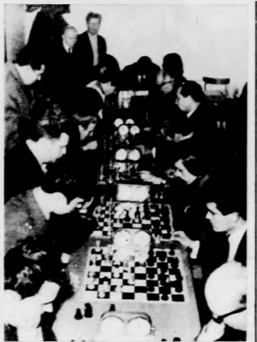
Az A-kategória mezőnye

A felszabadulási sakk villámtorna végeredménye. A-kategória: 1. Halász (D. Spartacus) 11,5, 2. Kovács L. (D. Spartacus) 10,5, 3. Bednár (D. Spartacus) 10,5, 4. Beniczik (D. Honvéd Bocskaik) 10,5, 5. Sipos F. (D. Sparta-