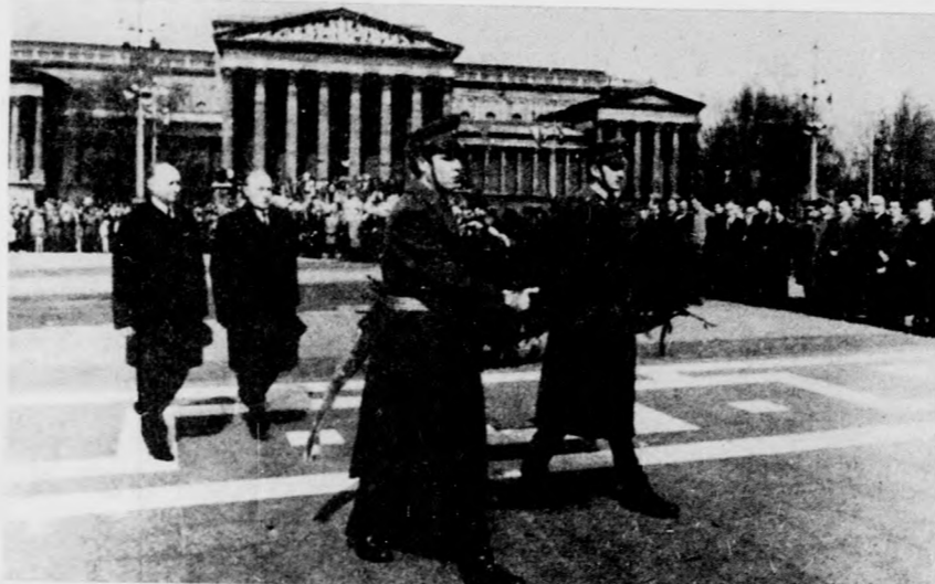
A magyar hősök emlékművénél az MSZMP KB nevében Kádár János és Biszku Béla koszorúz

nek lényege az, hogy megőrizve minden értéket, amit népünk évszázadokon át alkalmazott, elődeink haladó törekvéseit is megvalósítva, új társadalmi rendet, emberibb életet teremtettünk. Büszkének lehetünk és büszkének is vagyunk eredményeinkre, amelyek ma már nemzetközi méretekben is elismerést vívtak ki hazánknak, népünknek, szocialista rendszerünknek. Népünk megmásíthatatlan történelmi vívmányait, amelyek fundamentumát képezik a szocialista társadalom teljes felépítésének, az alkotmány módosítása is szentesíti majd.