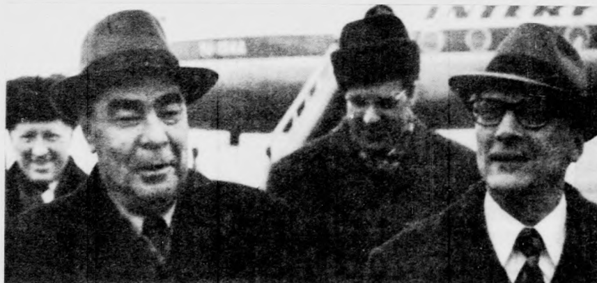
Nem hivatalos baráti látogatásra Moszkvába utazott Erich Honecker (jobboldalt), a Német Szocialista Egységpart Közpointi Bizottságának első titkára. A repülőtéren a vendéget Leonid Breznev, az SZKP KB főtítkára fogadta.

Ly Van Sau a párizsi értekezletnek amerikai és saigoni részről történt megszakítását súlyos szabotázscselekménynek minősítette, majd hangoztatta: az értekezlet bojkottálása ismét feltárja, hogy az Egyesült Államok által támogatott saigoni hadsereg vereségeire, a dél-vietnami hazafiai sikereire a nemzeti fel-