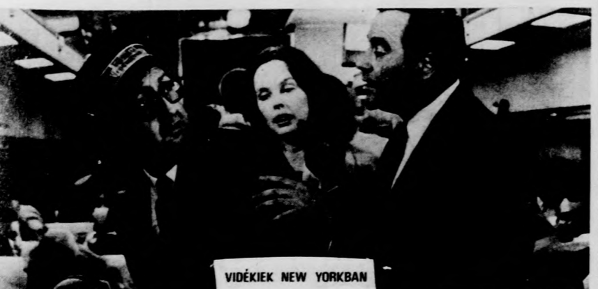
VIDÉKIEK NEW YORKBAN

A debreceni Vig moziban április 6-tól 9-ig a „Vidékiek New Yorkban” című színes, szinkronizált amerikai filmvígjátékot, április 10-től 12-ig a Holt vidék című színes új magyar filmet mutatják be a délutáni előadásokon. Az Apolló moziban április 6-tól 9-ig a Holt vidék című magyar film szerepel a délutáni előadások műsorán, este 8 órakor pedig „A völgy törvénye” című színes jugoszláv filmet vetítik. Április 10-től 12-ig a „Vidékiek New Yorkban” című amerikai filmet láthatják az érdeklődők. A Művész moziban április 6-tól 9-ig Wajda: Tájkép csata után című filmjét, a Filmmúzeumban április 11-én és 12-én André Delvaux: Egy este, egy vonat című színes, francia-belga filmjét vetítik.