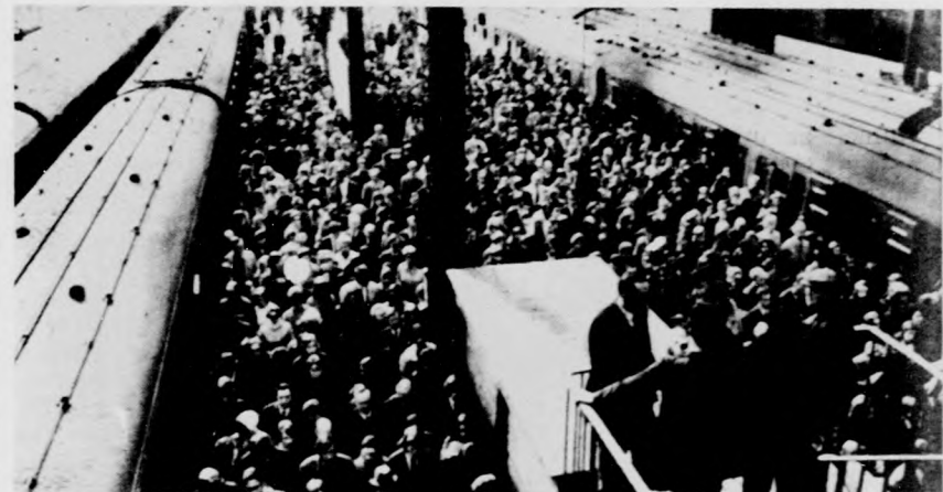
A londoni pályaudvaron óriási zsúfoltságot okozott a mozdonyvezetők munkalassítási mozgalma

A chilei haza és szabadság elnevezésű fasizta szervezet tagjai kedden meg akartak gyilkolni egy 18 éves kommunista egyetemistát. A Santiago melletti La Granjában egy gépkocsiból tüzet nyitottak a fiatalemberre és megsebesítették. A gyilkossági kísérlet a jobboldali erők provokatív tüntetése előtt történt. (ADN)