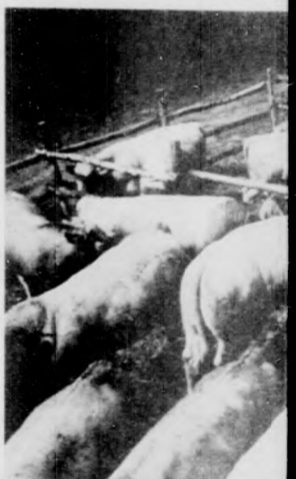
Exportbírák (Az első negyedéves lattenyészés.)

Világszerte alkalmakamelynek különösen előnyei vannak az ország számára, ahol valamilyen nincsen mód a jelentősebb apparátus létrehozására a hazai szakemberhiány nagyon sok ilyen vállalkozás meg az önálló szervezettel rendelkező vállalkozó adódhat olyan átfogó szervezési feladat, amely egy nagyobb apparátus meg. Egyszóval hasznos dolog igénybe venni a cajtájával működő szervezetek szolgáltatásait, s a egy része — kisebb részével a lehetőséggel, — majd hogy nem elem — meg is fogadják az adott tanácsokat. Fintomazva: a vállalatok nedő tartózkodással fogadják ajánlkozásait és általában bizalmatlanok ilyen kezdeményezéssel. Még furcsább jelenség, alati megrendel valamily zési munkát valamely feladat megoldására többan is elkészítik a tanul-