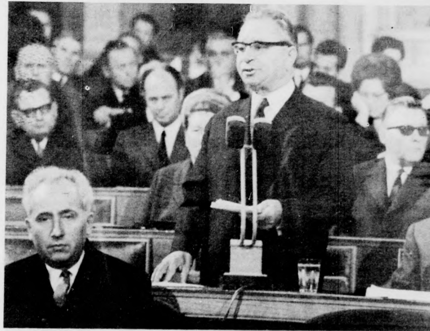
Kállai Gyula, az alkotmány-előkészítő bizottság elnöke terjesztette be a Magyar Népköztársaság Alkotmányának módosító szövegét.

Kállai Gyula, az alkotmánymódosítást előkészítő országgyűlési bizottság elnöke emelkedett szószállásra.