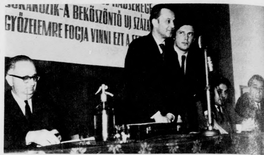
Előadás a pártiskolán