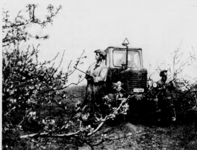
Permetezik a tízezes almáikat (Az éves terv 140 vagon alma.)