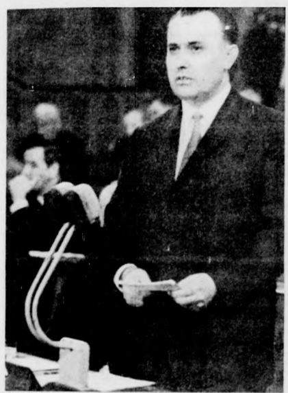
Dr. Korom Mihály igazságügy-miniszter a Magyar Népköztársaság kormányának nevében beszélt az alkotmánymódosításról.

A törvényjavaslat a társadalmi rendről szóló fejezetben fogalmazza meg a szocialista gazdasági rend jogi alapelveit. Kifejezi, hogy gazdasági rendünk a termelési eszközök társadalmi tulajdonára épül, ezen az alapon megerősíti népgaz-