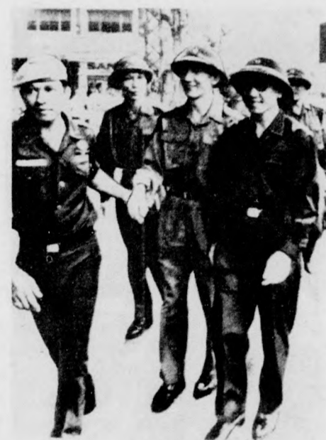
Tran Van Tra tábornok (jobb oldalon) Saigonban látogatást tett a Nemzetközi Ellenőrző és Felügyelő Bizottság indonéz delegációjának vezetőjénél. A DIFK-küldöttséget indonéz tiszt vezeti be a találkozó színhelyére.

Rogers külügyminiszter szerdán délelőtt a szenátus külügyi bizottságának ülésén derűlátóan nyilatkozott a vietnami tűzszüneti megállapodás végrehajtásáról, üdvözölte a laoszi tűzszüneti megállapodás aláírását, de „aggasztónak” nevezte a kambodzsai helyzetet. Rogers — éppúgy, mint korábban a képviselőház külügyi bizottságában — arról igyekezett meggyőzni a szenátorokat, hogy az Indokínának, s ezen belül a VDK-nak ígért újjáépítési hozzájárulás „az USA részéről hasznos békebefektetés”.