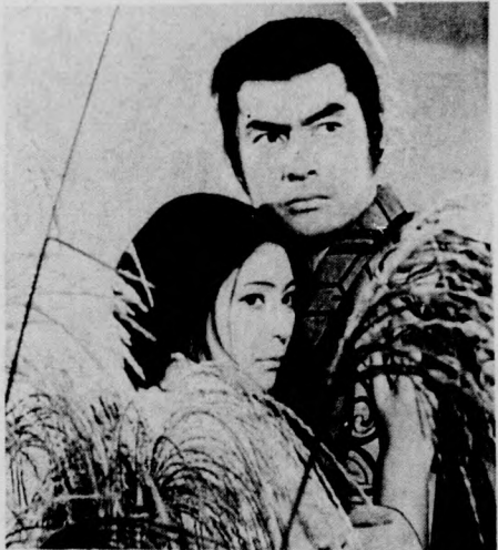
AZ ÜZÖTT SZAMURAJ

A Filmmúzeum műsorán francia—olasz film, az ADIEU, PHILIPPINE szerepel február 27-én, kedden.