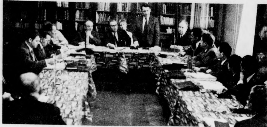
Kezdődik a tanácskozás

Nehezen megoldható, s teljes egészében talán nem is lehetséges, hogy mindenki személy szerint ismerje azt, akinek a neve a szavazólapra szerepel majd. De törekedni kell rá, hogy minél többen megismerjék, s ennek érdekében keresni kell minden lehetséges alkalmat, megoldást.