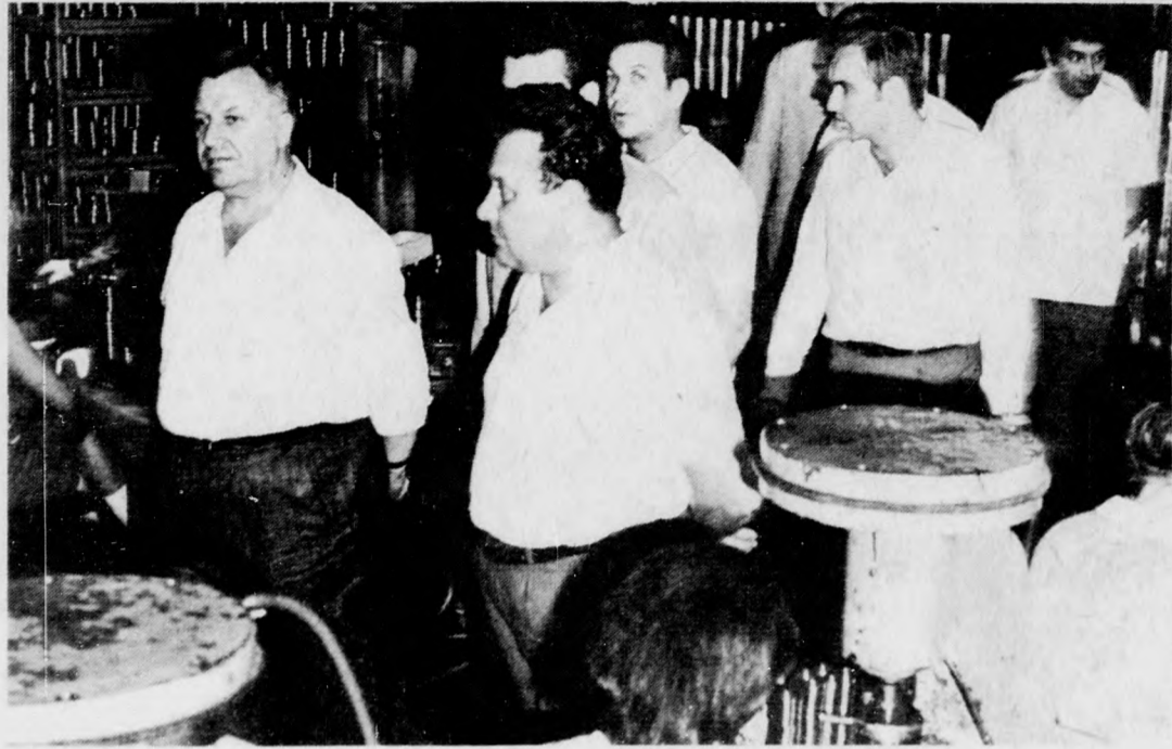
Felvételünkön: ismerkedés az MGM debreceni gyárával