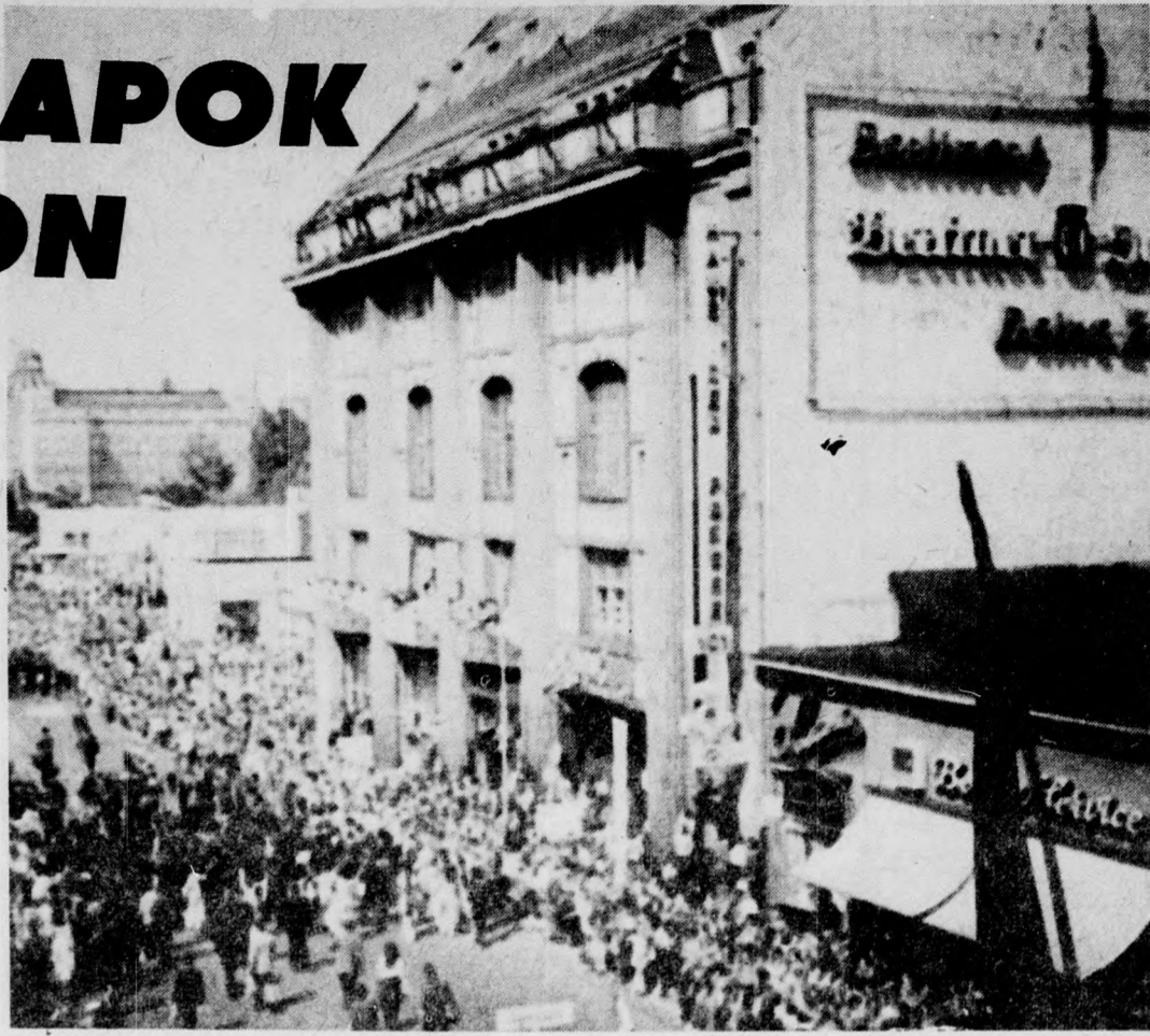
Felvonulók a Friedrich Strassen

A Metropol Theaterral szemben egy pad sarkán szorított helyet számomra néhány fiatal: éppen annyit, hogy melléjük állhattam. Ez főúri helynek számított. Fényképezni sajnos nem tudtam az előttünk álló tömeg miatt, így az-