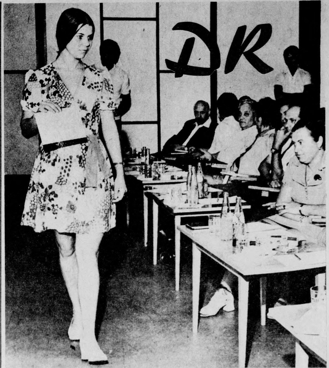
Egy csinos ruha a sok közül