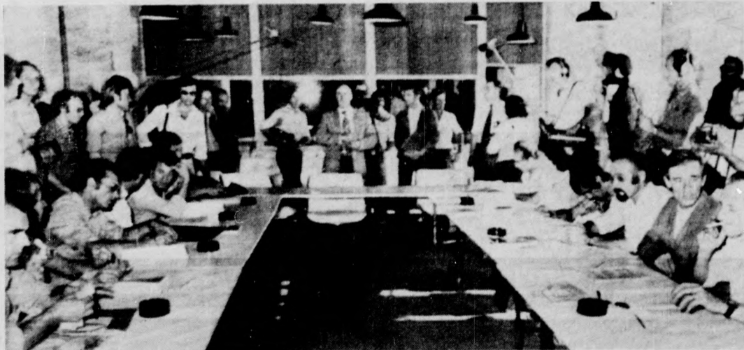
Besancon közelében, Arc et Senans-on a különböző szakszervezetek képviselőinek bevonásával tárgyalások kezdődtek.

Csütörtökön — a baloldali pártok és a szakszervezetek kezdeményezte szolidaritási nap keretében — sokhelyütt kerül sor több órás munkabeszüntetésre, a rádió és a televízió dolgozói pedig egész napos sztrájkjal fejezik ki szolidaritásukat. A rádió reggel óta csak zenét sugároz, a televízió ugyancsak úgynevezett minimális programot közvetít csupán.