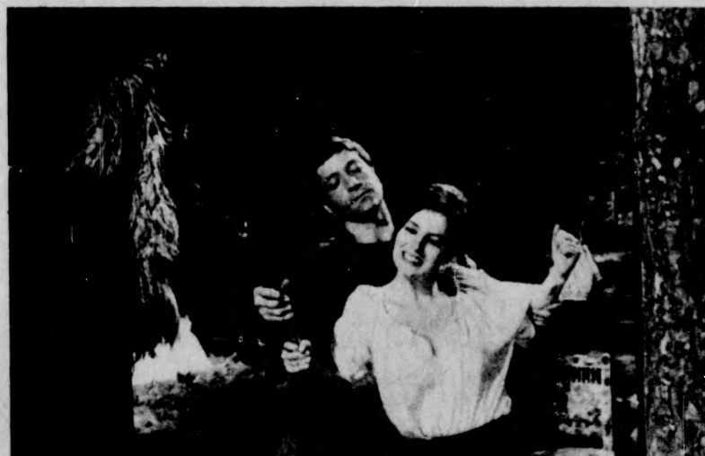
SZENT TERÉZ ÉS AZ ÖRDÖGÖK