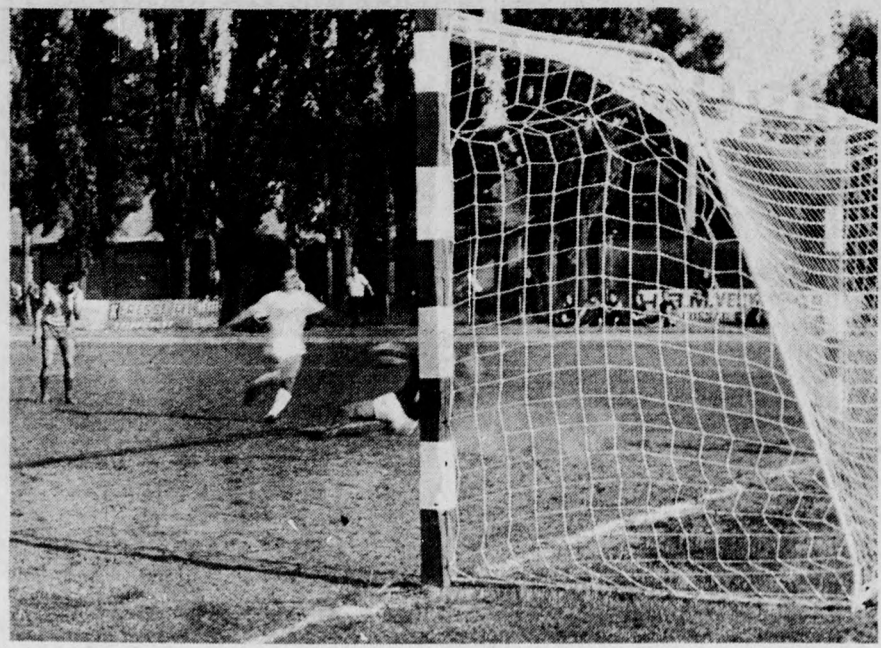
Szojka (fehérben) megszerzi a DVSC egyenlítő gólját

Elütötte a továbbjutástól a DVSC-t a H. Bocskai