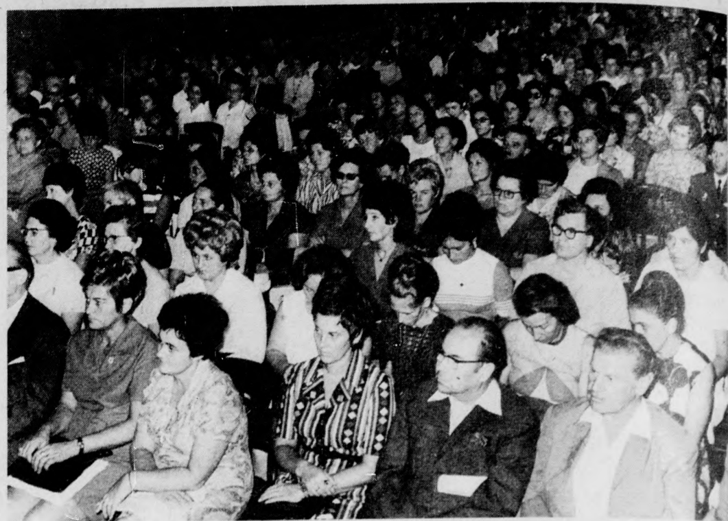
Az értekezlet résztvevőinek egy csoportja