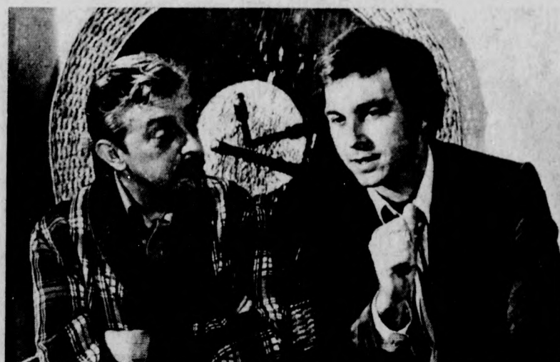
ÁRFAIAN GYILKOSOK A SZÉK- ÉS KÁRPIOSIPARI VÁLLALAT DEBRECENI GYÁRÁT

mán film, amelyet a Meteor mozi és a Hungária augusztus 23-tól 26-ig, az Apolló délelőtt és délután 27-től 29-ig játszik. A film története a második világháború idején játszódik. Ekkor kapja egy kapitány és egy őrnagy azt a megbízást, hogy a németek megszállta területen robbantsák fel a Szent Teréz magaslát. Munkájukat Júlia és a partizánok segítik. A Művész mozi az országos premier előtt tűzi műsorára az Ot könnyű darab című amerikai filmet 23-tól 26-ig.