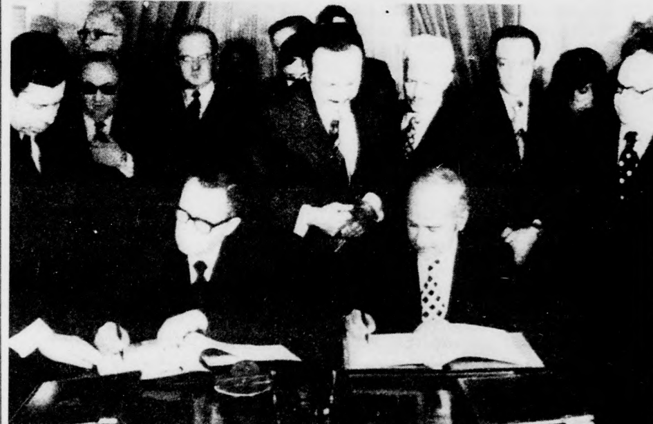
Andrej Gromiko szovjet és Ismail Fahmi egyiptomi külügyminiszter Kairóban a két ország közötti gazdasági, kulturális, és konzuli egyezményeket írt alá

Kedden délelőtt Kairóban folytatódott a megbeszélések Andrej Gromiko szovjet és Ismail Fahmi egyiptomi külügyminiszter között. A tárgyalások hétfői, első szakaszának lezárásaként mind Gromiko, mind Fahmi nyilatkozott. A szovjet külügyminiszter elmondta, hogy a tárgyalások átfogják a szovjet-egyiptomi viszony valamennyi területét és természetesen a közel-keleti térség helyzetét is részletesen megvizsgálják. „Nézeteink sok ponton találkoztak — mondta a szovjet külügyminiszter —, természetesen egy megbeszélés nem volt elegendő minden kérdés alapos megvitatására.” Ismail Fahmi kifejtette, hogy Egyiptom érdekelt abban, hogy a Szovjetunió továbbra is latba vesse nemzetközi befolyását az arab ügy