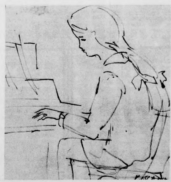
KISS ATTILA GRAFIKÁJA (TOLLRAJZ)