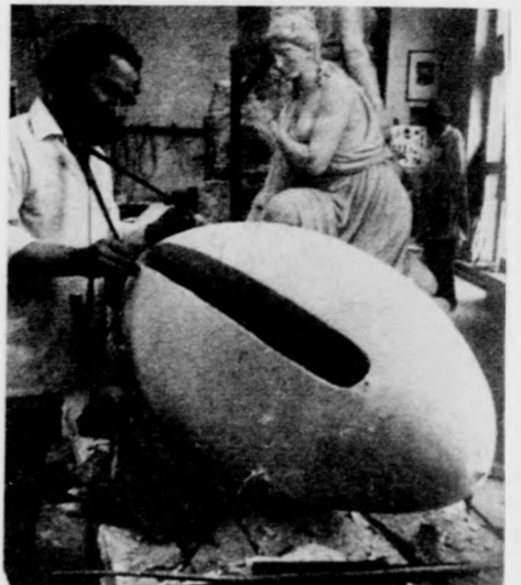
Április 4-én állítják fel a Lánchídnál Borsos Miklós „0” kilométerkövet díszítő alkotását

A Nagy Honvéd Házban évtelben a nemzetközi antifasiszta hadifogoly iskolán volt előadó, majd a felszabadulás után hazatérve, a központi vezetőség tagja, a párt központi pártiskolájának igazgatója lett, később pedig a Közgazdaságtudományi Egyetem rektora. Akadémia is tagjává választotta. Tudományos munkásságát államunk Kossuth-díjjal jutalmazta.