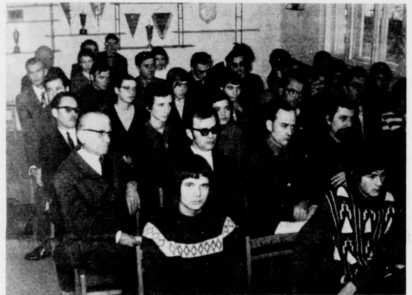
A résztvevők