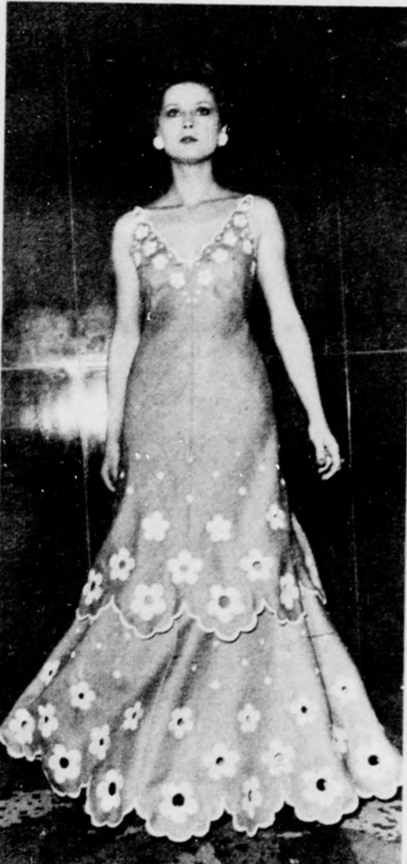
A Fővárosi Mértékutáni Szabóság a Gellért Szállóban mutatta be tavaszi-nyári divatújdonságait. A képen: Himzett nyári alkalmi öltözk