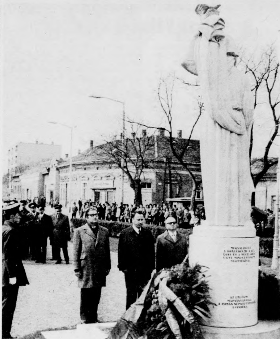
Az RKP küldöttsége megkoszorúzza a Román Hősök Emléküvét

Végül az Internacionálé hangjával zárult a felvonulás, amely emlékeztető demonstrációja volt felszabadulásunk 30. évfordulójának.