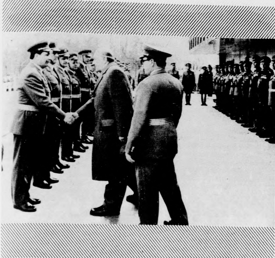
Kádár János, az MSZMP KB első titkára, Czinege Lajos vezérezredes, honvédelmi miniszter társaságában köszönti az április 4-i díszszemlén résztvevő alakulatok parancsnokait

Az ünnepi díszbe öltözött Dózsa György út városi lakosai az MSZMP KB első titkára, Kádár János vezetésével március 31-én, pénteken már jóval 10 óra előtt tíz- és tizezer ember foglalta el a helyet, hogy a verőfényes napsütésben zajló események minden percének tanúja lehessen. A felvonulási tér két oldalán felállított tribünökön mintegy 60 ezer fővárosi és vidéki dolgozó, meghívott vendég várta népköztársaságunk fegyveres erőinek katonai parádéját. A fehér- és vörösmárvány burkolatú dísztribünnel szemközt az épületek homlokzatát a szocialista országok zászlói díszítették, s ünnepi jelszavak emlékeztettek hazánk felszabadulásának 30. évfordulójára.