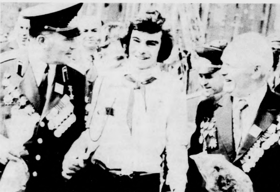
Az április 4-i ünnepségen résztvevő budapesti úttörők a hazánk felszabadításában kitűnt harcossal

Ezután szinte végeláthatatlan áradással töltötték be a teret, színpompájuk, vidámságuk feledhetetlen percekét szerzett minden néző-