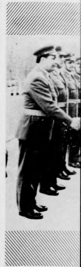
Kádár János, az honvédelmi miniszter résztvevő alakulató

Az ünnepi díszbe György út városi április 4-én, péntek óra előtt tíz- és tizenlatta el helyét, hogy napsütésben zajló események tanúja felvonulási tér két oldalon mintegy tíz és vidéki dolgozó, aki várta népköztársaság erők katonai dísztribünél szemközt a zászló díszítették, s vak emlékeztetők hádlásának 30. évford