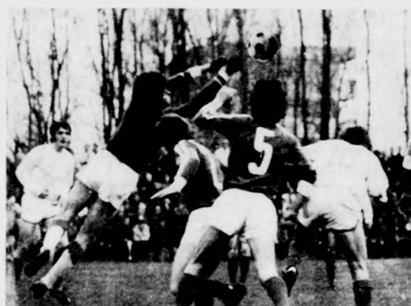
Munkában a gyöngyösi védelem (DMTE—Gyöngyös 1-1.) — Mikle egyenlítő gólja (Záhony—Hajdú Vasas 1-1.)

megyei szövetség díját és a Felszabadulási Napló Kupa vándorserleget a győztes Kaba MEDOSZ csapatkapitányának. A labdarúgó edzők és a játévezetők április 7-én, hétfőn délután 5 órakor továbbköpzés céljából szegyeivel tartanak az Állami Építőipari Vállalat Kalvin téri székházában, illetve a Vízvezet Igazgatóság Hatvan utcai klubtermében.