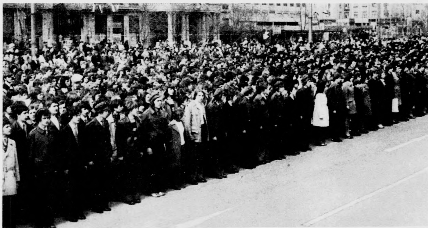
Kétezer ifjúkommunista tett fogadalmat

A fogadalomtétel után, délelőtt 11 órakor megyénk politikai és társadalmi életének vezetői, a megyénkben tartózkodó külföldi delegációk tagjai, a tömegszervezetek, valamint a fegyveres testületek képviselői megkoszorúzták a debreceni Köztetetőben levő szovjet hősi emlékművet, majd déli 12 órakor a Benedek téren levő román