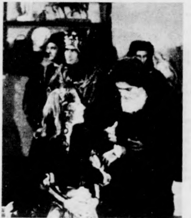
Jelenet a FLAMANDOK TITKÁJA című francia filmsorozat I. részéből és a „MARIE” című NSZK filmből

8.00 Idősebbek is elkezdhetik... Tévétorna (ism.). 8.05-10.20 Iskolatévé. 10.20 Műsorismertetés. 10.21 Delta. Tudományos híradó. 11.00 Minden lében két kanál. Angol tévéfilmsorozat. 11.55 Játék a bűnökkel (ism.). 12.15 Cole Porter műsora. 13.05-13.25 Iskolatévé. 17.13 Műsorismertetés. 17.15 Hírek. 17.20 A Közösségszolgálat tájékoztatója. 17.25 Dynamo Dresden—FC Liverpool. UEFA Kupa labdarúgó-mérkőzés. 19.20 Esti mese. 19.30 TV-híradó. 20.00 Idősebbek is elkezdhetik... Tévétorna. 20.05 A flamandok titka. Francia tévéfilmsorozat. I. rész. 21.00 A TV-híradó különkiadása az SZKP XXV. kongresszusáról. 21.20 Magyar tájak 2. rész. A tatányai medence. 21.50 Látogatásban Hauser Arnoldnál. Portréfilm I. rész. 22.10 TV-híradó. Harmadik kiadás.