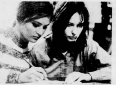
BUDAPEST, 2. műsor

20.00 Műsorismertetés. 20.01 Tisztelegés Sopronnak. 20.40 Veszélykereső. Amerikai rövidfilm. 20.50 TV-híradó. második kiadás. 21.10-22.45 Marie. NSZK tévéfilm.