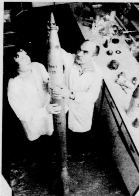
A Baranya megyében létesült jégeső- elhárító rendszer készülő biztonsági és kezelési szabályzata mellett a Nehéz- ipari Minisztérium vegyi és robbanó- anyagipari felügyeletének szakemberei meteorológiai rakétákat is készítenek elő oktatási céljaira. Tavasszal ugyanis megkezdik a jelhártó rendszer személynézők kiképzését és ehhez két rakétatípust — egy kisebb és egy nagyobb hatástokut — demonstrációs cél- ra készítenek elő, hatástalanítanak a szakemberek.

VIZSGA ZENÉSZEKNEK. Az Országos Szórákkozatózenei Központ májusban vizsgákat rendez a szórák- koztatásban használatos népi- és tánczenei hangszerek megszólaltatói és az énekesek számára. A vizsgákra március 15-ig lehet je- lentkezni az OSZK megyei kiren- deltségén (Debrecen, Vörös Hadsereg útja 49. II. emelet 19.).