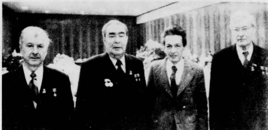
Leonid Brezsnyev, az SZKP KB főtíkára a Kremlben fogadta Enrico Berlinguert, az Olasz Kommunista Párt főtíkárat (jobbról a második). A találkozóon jelen volt Boris Ponomarjov (bal szélen) és Mihail Suszlov (jobb szélen), az SZKP Politikai Bizottságának tagjai

Meggyőződésünk, hogy megbízható támaszunk van, olyan szövetségeseinkkel rendelkezünk, amelyek segítségben részesítették és részesítik igazságos küzdelmünket. A Szovjetunió és a többi szocialista