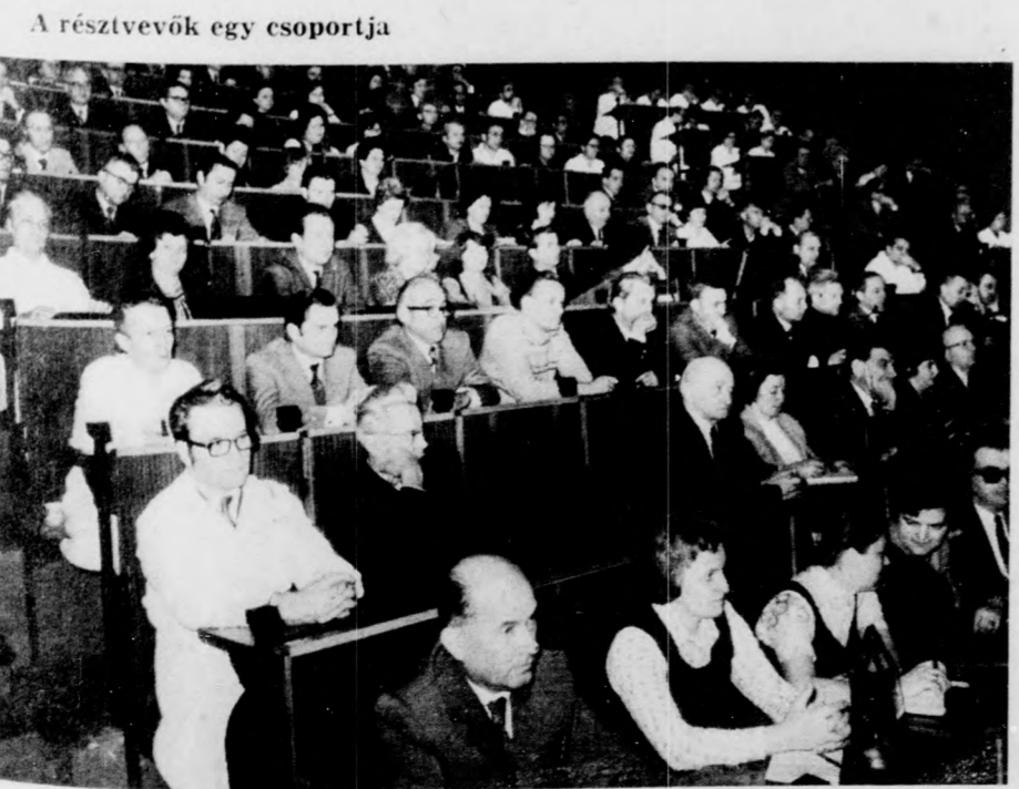
A résztvevők egy csoportja