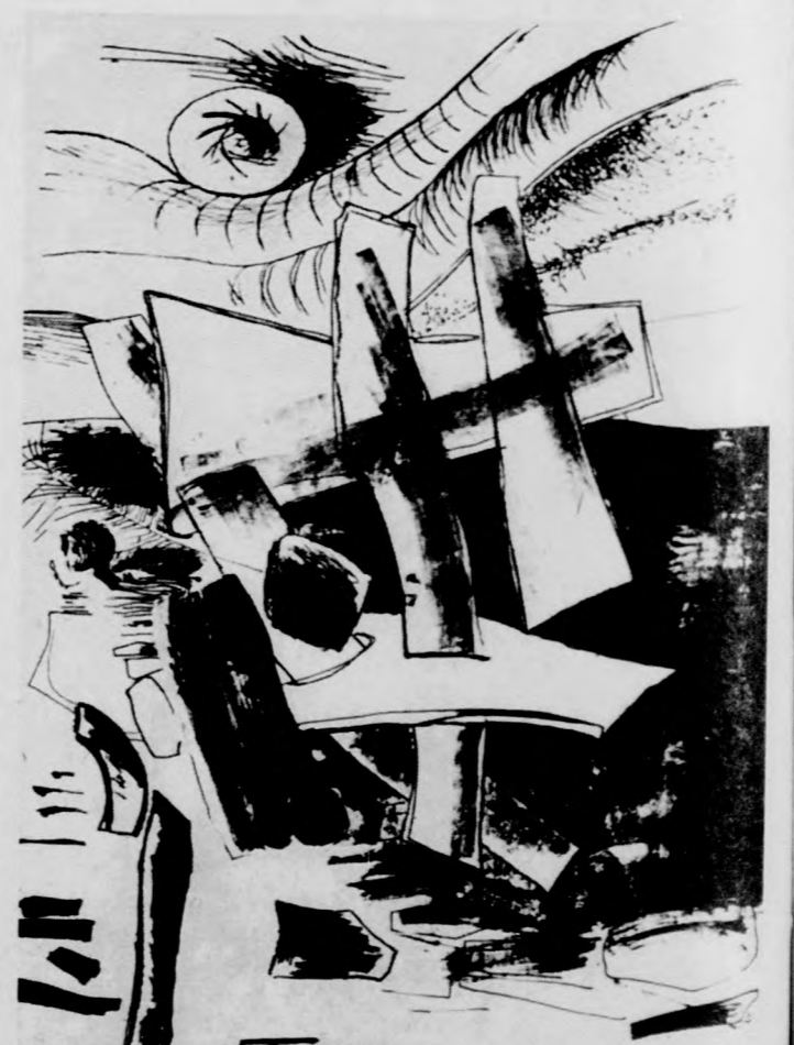
Topor András litográfiája

Az MSZMP Hajdú-Bihari Bizottsága Oktatási Bizottsága 1976/1977. tanévre pályázatot hirdet a Marx-Leninizmus Esti Egyetemi tagozataira: