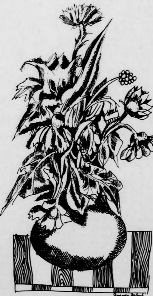
Gonda Zoltán: Tavasz virág