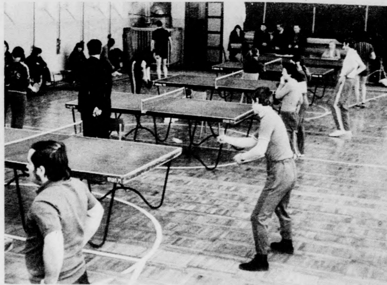
Munkában az asztaliteniszesezők