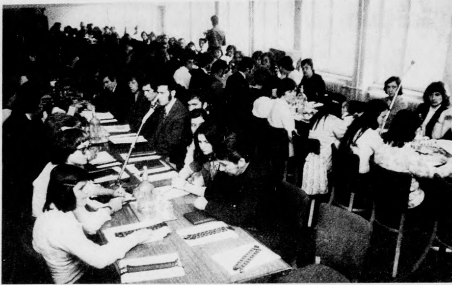
A küldöttértekezlet résztvevőinek egy csoportja

Szünet után a küldöttgyűlés megkezdte a vitát az előterjesztések fő