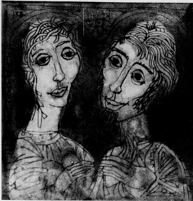
Cs. Uhrin Tibor: Tűzzománc

Cs. Uhrin szinte valamennyi művében a szépség megannyi arcát, fajtáját, változatát veszi észre és teszi meg. Egyetlen ponton válik bizonytalanná. Mikor az egyébként elfogadható ünneplésszerű minőségre mellé pusztán elbeszélő elemeket illeszt, a mű szét-hullik (N. S. emlékére). Végül kérdéses, hogy mit szolgálhatnak inkább a kapcsolatok. Nem művészi zűrzavar-e a kapcsolat ez sem. Inkább afféle határátlépés. Azt jelzi, hogy Cs. Uhrin világa a líraiságon belül terül el.