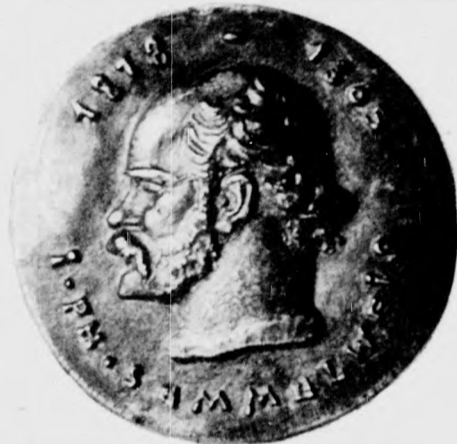
A gyűjteményben nagyon sok érme látható, amely Semmelweis emlékét idézi

— Szerencsés helyzetben vagyok, mert az utóbbi időben az egyetemen elég sok érme készül. Ezeket általában sikerül megszerezni. Természetesen ez így van a budapesti, vagy a szegedi egyetemen is, s ha találok egy partnert, aki ott megszerzi nekem a megjelenő darabokat, az itteniekért szívesen cserélek. Jelenleg egy szegedi kollégá-