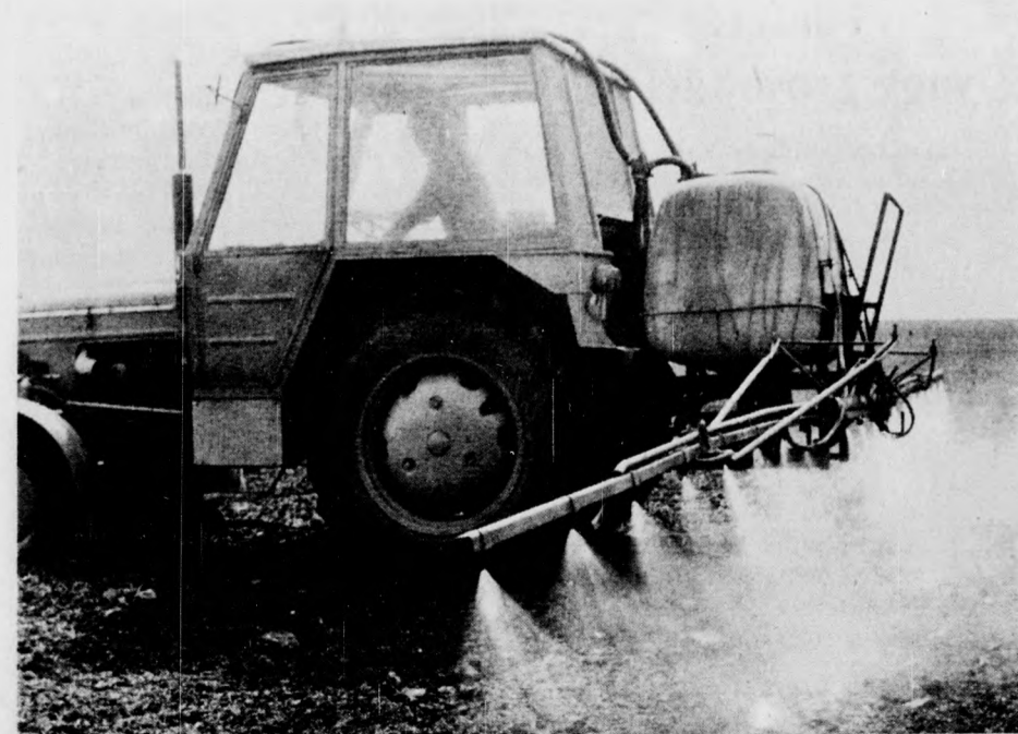
Jó földre kerül a mag a Hortobágyi Állami Gazdaságban