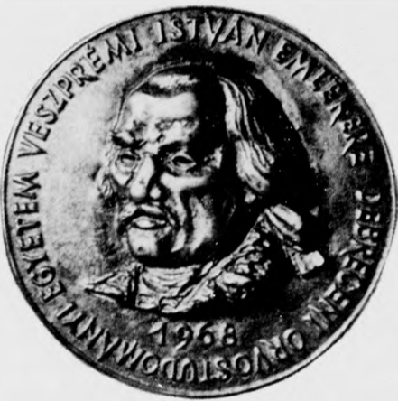
Ez a Veszprémi érme a ritkaságok közül való: hibásan, „V”-vel írták a professzor nevét

Hogy hányan gyűjtenek az országban orvosi érmet? Nem tudom, de azt hiszem, nagyon kevesen. Debrecenben senkit nem ismerek. No, persze vannak akik megőrzik, az emlékérmek gyűjtői biztosan elteszik az orvosi vonatkozásúakat is. De kizárólag orvosi érme gyűjtésével úgy tudom, a városban egyedül én foglalkozom. Csak magyar érmeiket gyűjtök és ezek közül is azokat, amelyek személyes vonatkozásúak — tehát valakinek az arcképe látható rajta, esetleg valakinek a tiszteletére készítették. Tulajdonképpen ehhez a területhez tartoznak a kongresszusok, események alkalmából készült érmeik, s az orvosi jelvények is. Ezeket nem gyűjtöm, mondhatnám, hogy „szakosodtam” a személyekre.