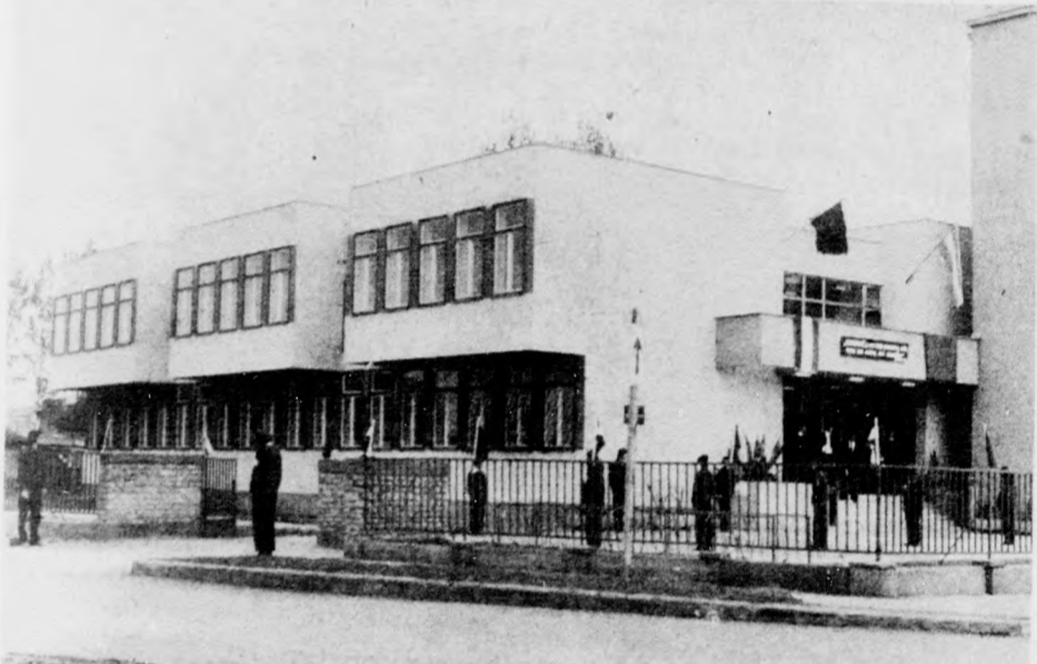
A 126. számú Szakmunkásképző Intézet új épülete

Átadták Berettyóújfaluban a 126. számú Szakmunkásképző Intézet új épületét