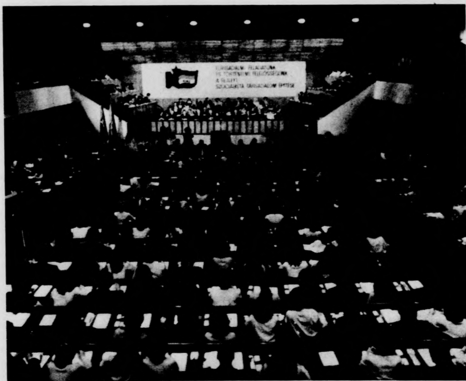
Ülésezik a KISZ IX. kongresszusa