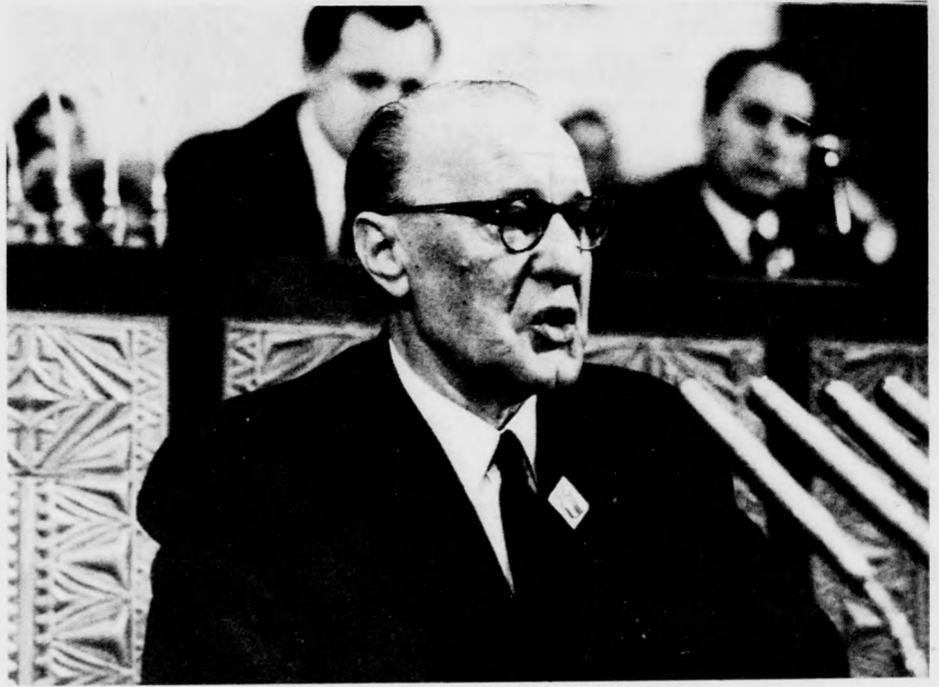
Kádár János, az MSZMP KB első titkára a KISZ IX. kongresszusán