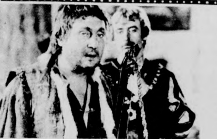
FELKÉLOK ÁBRUHÁBAN Tudósítások a népi kultúráról

Szines, spanyol-olasz filmvígjáték a Különböző dühbe jövők, amelyet Marcello Fontado rendezett. Ismert színészek, ismert rendező: Bud Spencer a Sötét Torino, a Piedone, a zsaru, Terence Hill pedig a Vigyázat, Vadnyugat! című filmekben láthatja a magyar közönség.