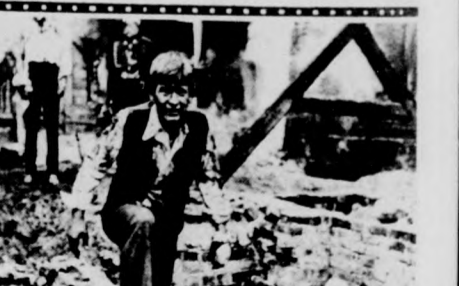
A KUTYÁK A kutyák és az ember

Szines, szinkronizált filmjét láthatja a közönség.