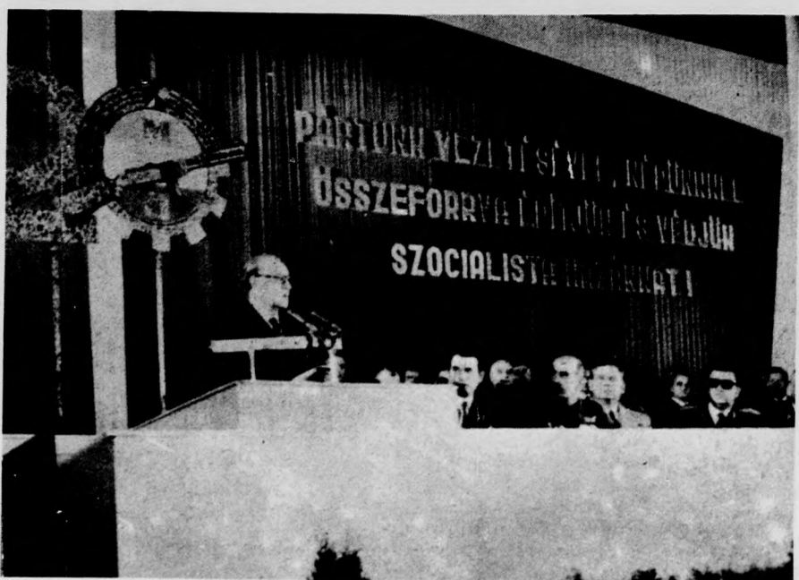
Kádár János, az MSZMP KB első titkára mondott beszédet a munkásör zászlóalj ünnepségén

— Az alapítók lassan elbúcsúznak az önként vállalt fegyveres szolgálattól, az egészség mégis fiatal, forradalmi marad, mert sorait az új nemzedék legjobbjai gyarapítják.