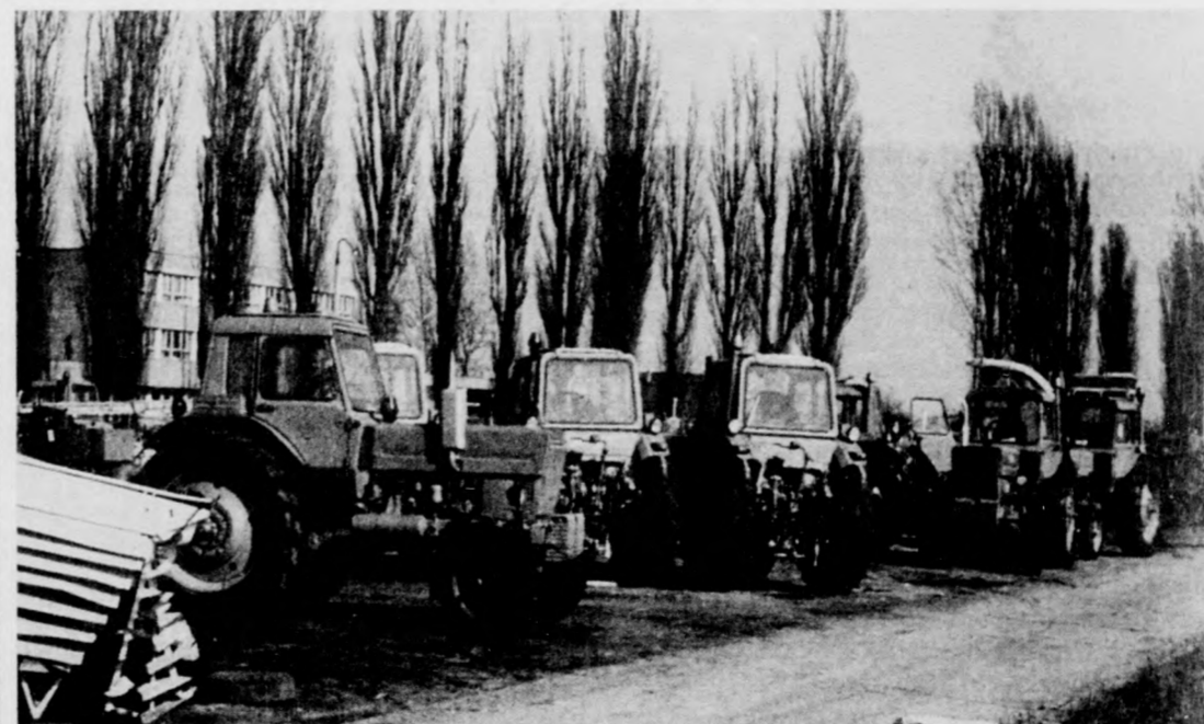
NDK gyártmányú E-301-es önjáró száraztakarmányt betakarító gép várja a vevőket

Idén 380 darab MTZ-80-as traktor érkezik a megyébe