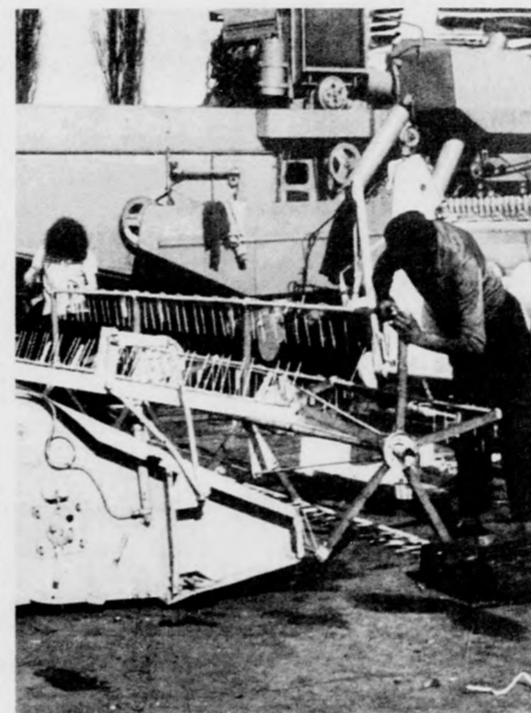
Szerelik az AGROKOR dolgozói a kombajnok vágószerveit