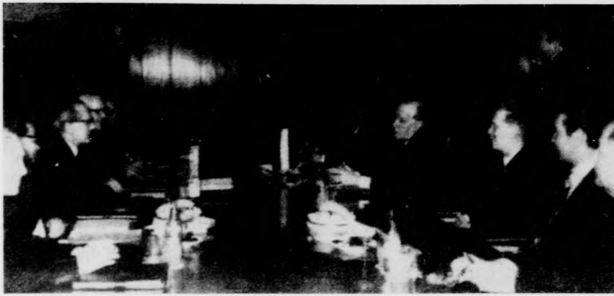
Berlinben folytatódta a tárgyalások a Kádár János vezette magyar és az Erich Honecker által vezetett NDK párt- és kormányküldöttség között

A tárgyalások célja a magas fokra jutott kapcsolatok további erősítése, az hogy a jó viszony még jobb, az eredményes együttműködés még hatékonyabb legyen, s ezzel új, minőségében meg tartalmasabb színvonalú szakasz kezdődjék a magyar-NDK viszonyban. Mindkét párt vezetője kiemelte ebből a szempontból a Berlinben csütörtökön aláírandó új barátsági, együttműködési és kölcsönös segítségnyújtási szerződés megkülönböztetett fontosságát, mivel a szerződés — Erich Honecker szavaival — „most, amikor országunkban a fejlett szocialista társadalom épül, hosszú távra meghatározza szívélyes, testvéri kétoldalú kapcsolatainkat”.