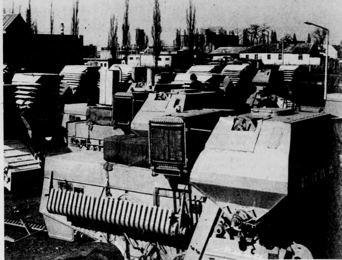
Jelenleg negyven darab szovjet gyártmányú SZK-5-ös kombajn vár vevőre a telepen