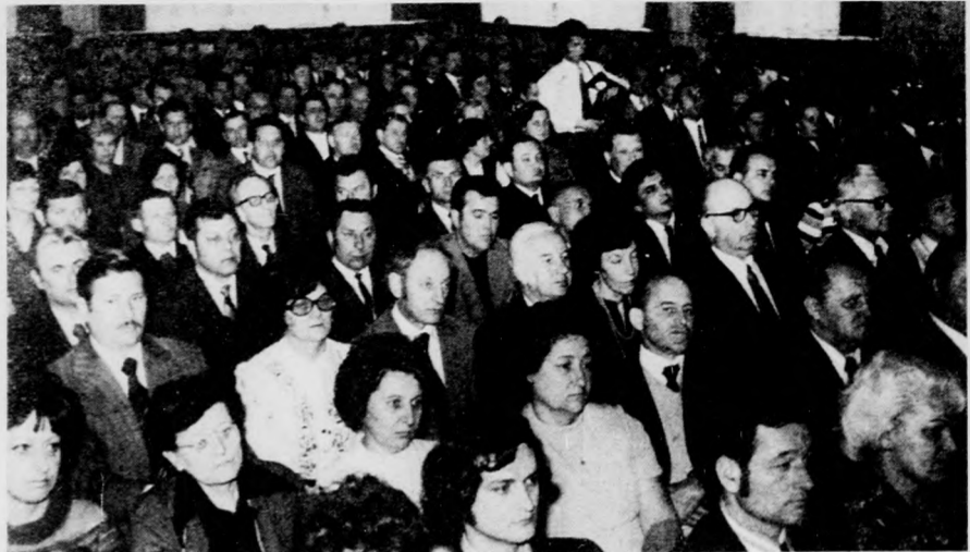
Az ünnepség résztvevői

emlékművet — az Internacionálé hangjaival ért véget. Délelőtt tíz órakor, illetve háromnegyed tizenegyre — ugyan-csak katonai tiszteletadás mellett — megyénk politikai és társadalmi életének képviselői, megyénk vendégei koszorút helyeztek el a Kőzetemetőben levő szovjet hősi emlékműnél, valamint a Benedek téri román hősök emlékművének.