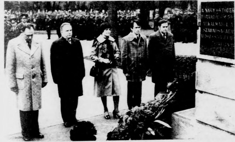
A litván delegáció a szovjet hősi emlékmű előtt tiszteleg