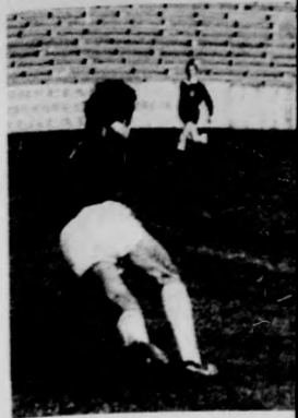
Diószegi a DVSC más nap is eredményes volt