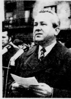
Pataki György köszönti az új KISZ-tagokat