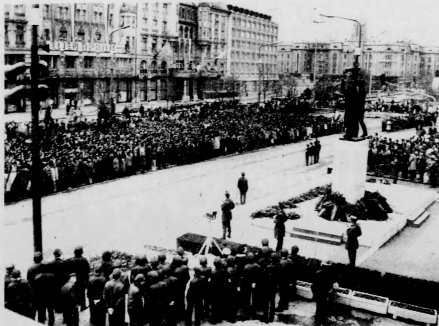
Fogadalomtételre felsorakozott ifjúkommunisták