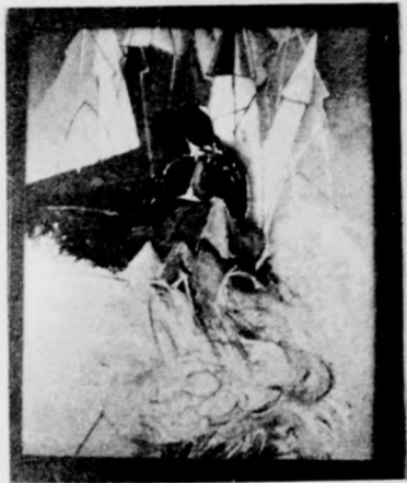
Turcsán Miklós: A papék Katója

„Új vizeken járok” címmel kiállítást nyi- tottak Ady Endre születésének 100. évfor- dulója alkalmából a Petőfi Irodalmi Mú- zeumban, a múzeum és a Fiala Képzőművé- szek Stúdiója 1977. évi pályázatának anya- gából.