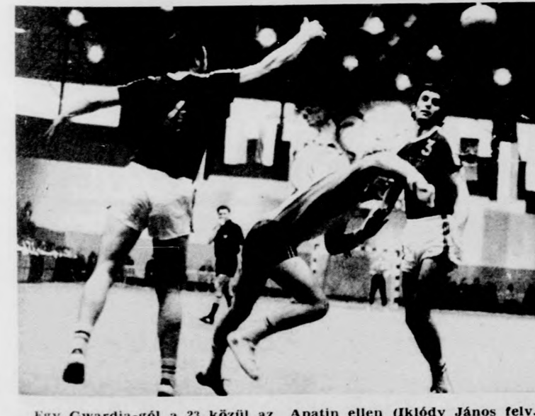
Egy Gwardia-gól a 23. körül az Apatin ellen

A megyei ifjúsági labdarúgó-válogatottak országos tornája a befejezéshez közeledik. Az eddigiek után legjobb nyolc válogatott két négyes csoportban küzd, s a csoportgyőztesek a „legjobb” címért mérkőznek majd. A B csoportba került ifjúsági válogatottak — Szabolcs-Szatmár, Nógrád, Borsod és Hajdú-Bihar — kedden kezdték el a körmérkőzéses rendszerű játékot. Nyíregyházán. A második forduló után a debreceni Tiszavasváriban, a befejező, harmadik forduló pedig pénteken kerül sor, ismét Nyíregyházán. Kedd eredmények: Szabolcs-Szatmár-Borsod 2-1