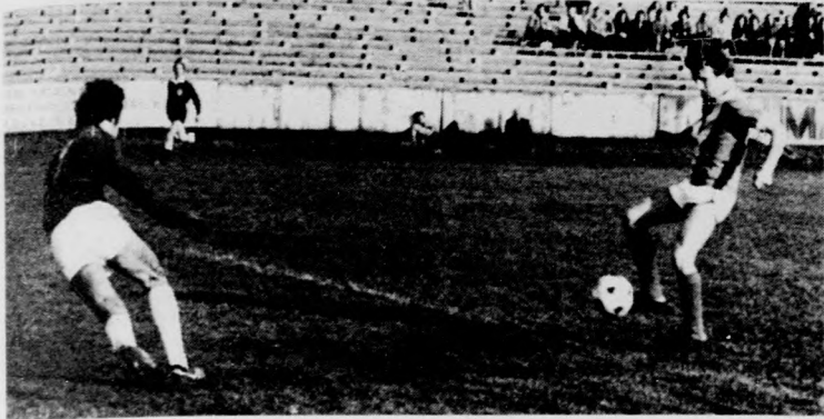
Díszegri a DVSC második gólját szerzi az FC Bihor ellen, vasárnap is eredményes volt, ő szerzte meg a DVSC első gólját, Komló (Kalmár István felv.)