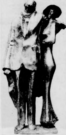
Borbás Tibor: Ady Lédával