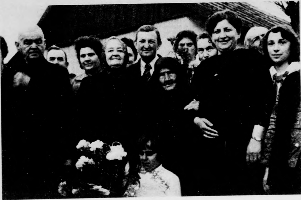
Az ünneplők