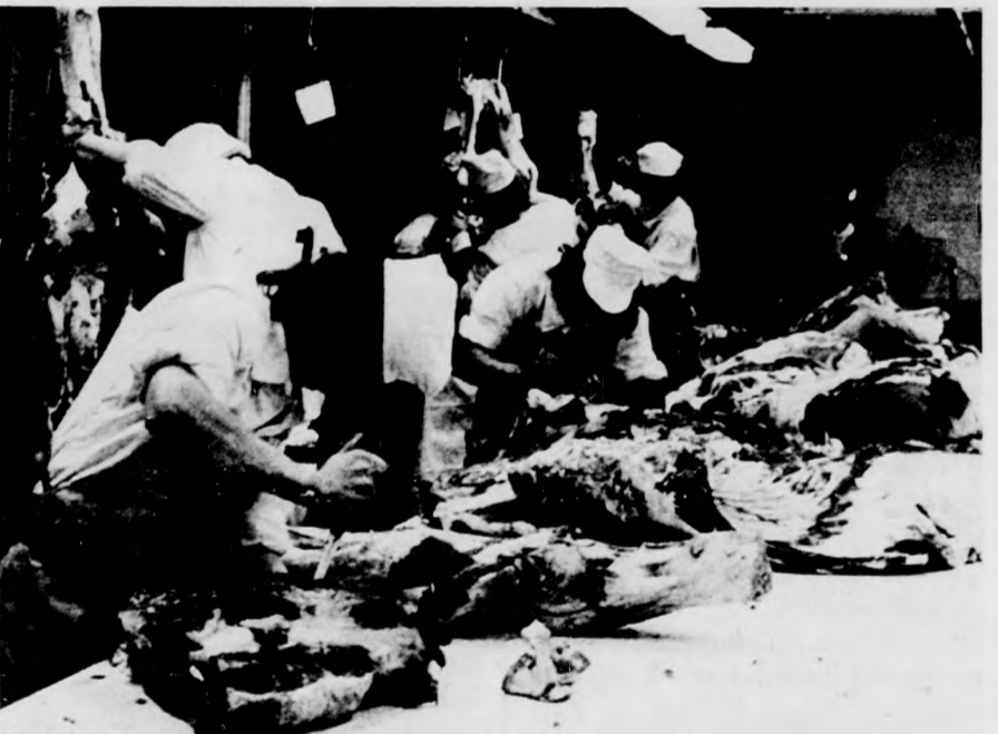
A gyakorlati versenyen

lamint az Irinyi János Élelmiszeripari Szakközépiskola és Szakmunkásképző Intézet április 5. és 7. között.