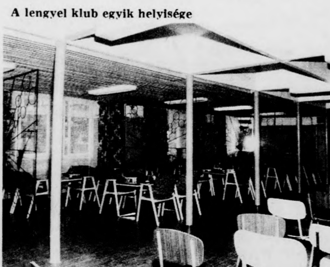
A lengyel klub egyik helyisége