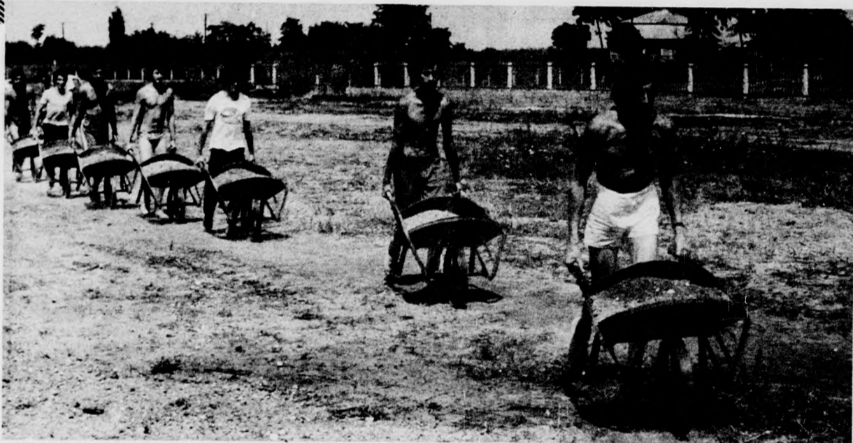
Megérkezett a soder

felügyelőség vezetője. — Az elmúlt héten a 109. sz. Ipari Szakmunkásképzőből, most a Landler és a Gépipari Szakközépiskolából, valamint a pallagi Balásházy János Mezőgazdasági Szakközépiskolából vannak itt diákok. Reggel héttől délután kettőig dolgoznak, autóbussz hozza-viszi őket, tízórait és ebédet kapnak.