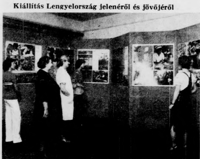
Kiállítás Lengyelország jelenéről és jövőjéről

A kulturális rendezvénysorozat keretében ugyancsak július 21-én adták át Hajdúszoboszlón, a Bőszörményi úton a lengyel klubot. A munkások a cukorgyár elkészültéig itt tölthetik majd szabad idejüket. Könyvtárhelyiséget, játéktérmet hoztak létre, valamint egy nagyobb helyiséget, ahol filmvetítésre, tv-nézésre is lehetőség van. A szép, új klubot a lengyel munkások maguk építették és rendezték be, hogy kellemesen tölthessék szabad idejüket.