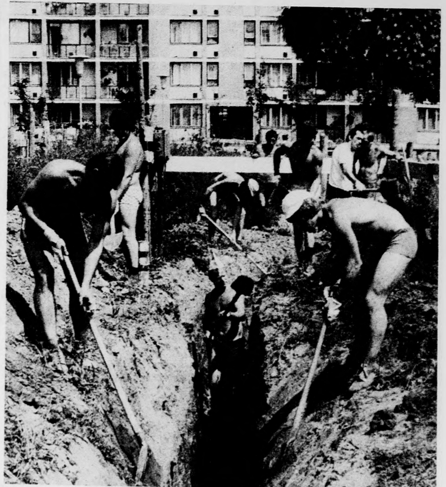
Szovjet fiatalok a Mester utcai építkezésen