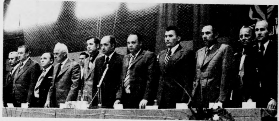
A közgyűlés elnöksége