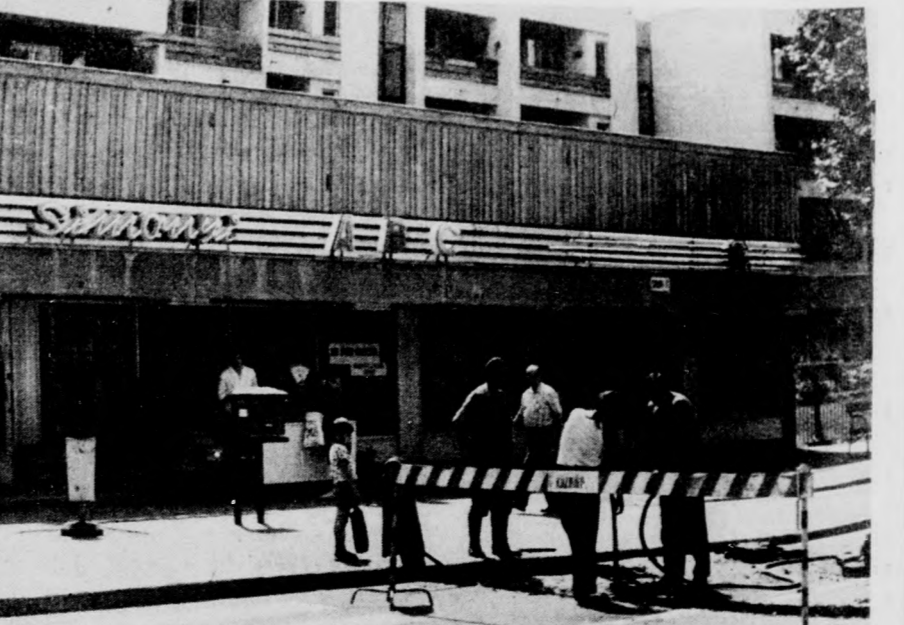
A Simonyi ABC előtt is...