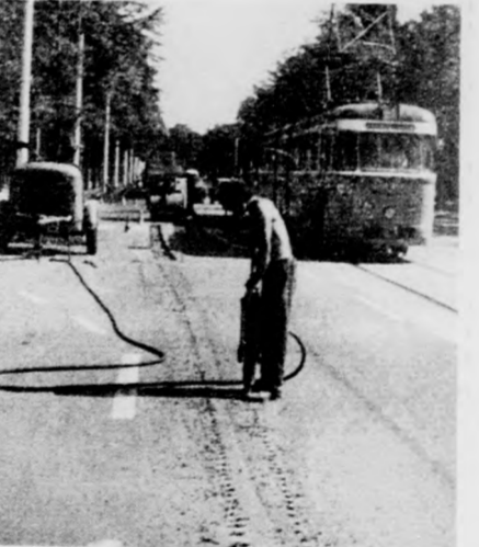
Légkalapács zajától hangos a környék

— Nem pazarlás egy ilyen korán szükségessé vált javítás? — kérdeztük a munkásoktól. Ők csak legyintettek: nem ez itt az egyetlen gond. Holmi kimaradt közmű miatt hamarosan egy másik helyen is feltörik a betont. Mint mellékelt képünkön látható, a Simonyi ABC előtt ez