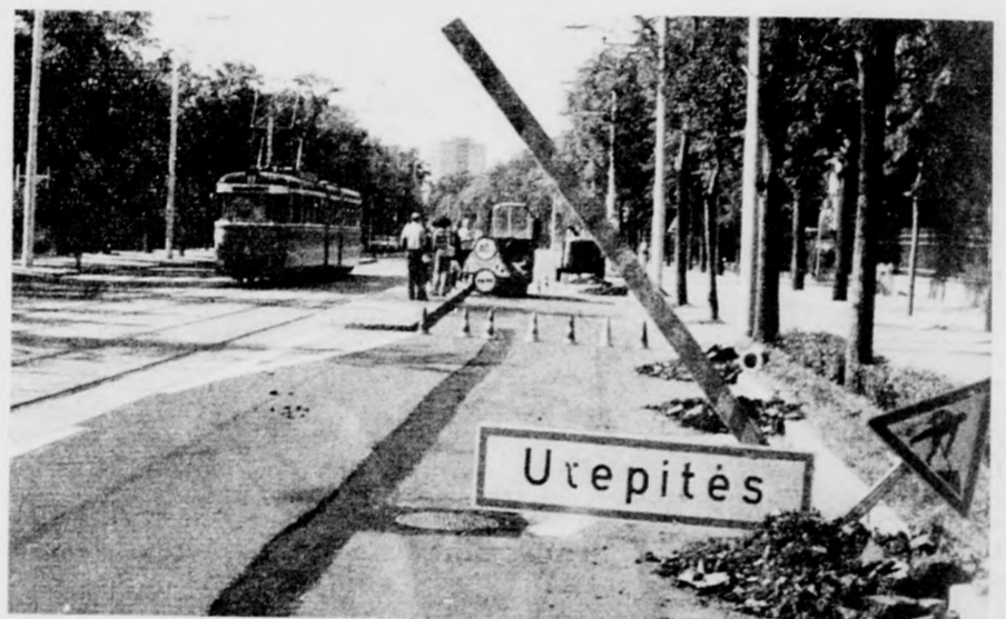
Útépítés útépítés után

A júliusi szám, az Eszméért, forradalomért rovatban a mártírhálált halt Békés Glasz Imrénének állít emléket.