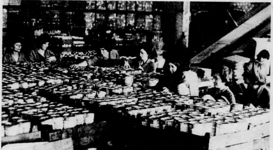
Egy magyar brigád is dolgozik a nemzetközi építőtáborban