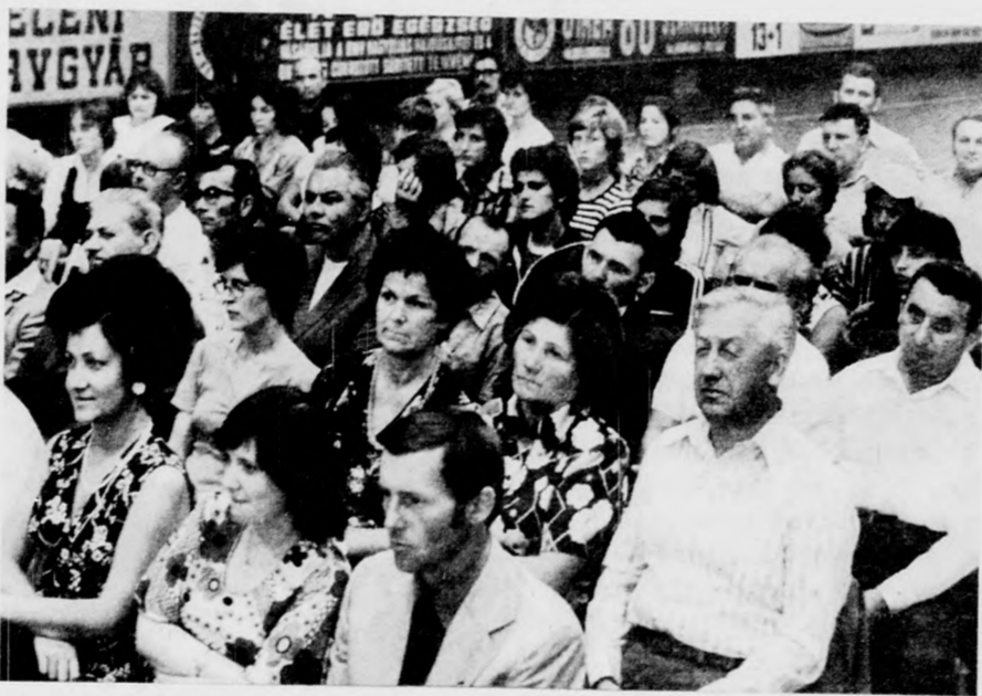
Az egykori és a mai sportolók egy csoportja