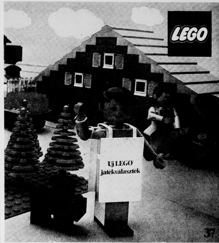
A LEGO nagy sikert aratott