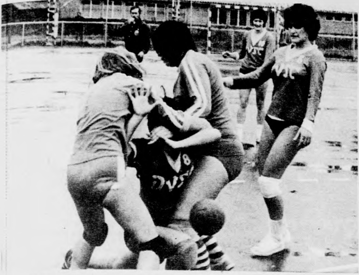
„Keményen” védekeznek a diógyőri lányok