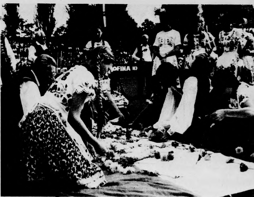
Krems, városi stadion. Az ünnepi felvonuláson virágosó hullott a ma- gyar táncosok zászlójára