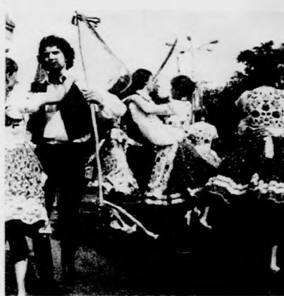
Táncos gála a kremisi utcákon