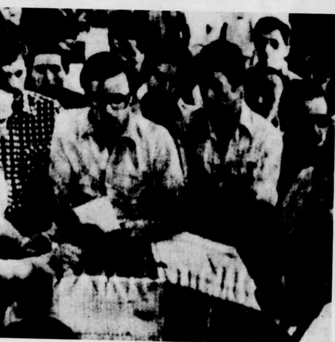
Kinyitják a szavazóurnákat Santiagóban

A kereszténydemokrata párt szerdán este közzétett nyilatkozatában csalásnak nevezte a referendumot. AFP, AP, UPI, MTI)