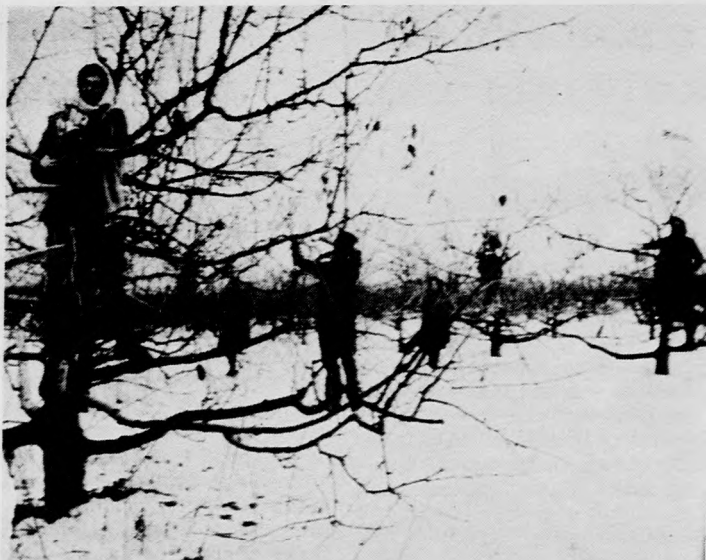
Hozzákezdtek a fák metszéséhez a hernádi Március 15. Mgt. gyümölcsösében. Képünkön: Az almáskertben dolgoznak a metszőbírók

Az élelmiszeripari üzemek több mint 12 milliárd forintot beruházást valósítanak meg. Az összeg harmadát fordítják új létesítményekre, kétharmadát pedig rekonstrukcióra, illetve felújításra költik. Az állami nagyberuházások közül elkészül a gyulai hűsöntvény és Zalaegerszeg az új hűtőház. Folytatódik a Hajdúsági Cukorgyár s a szekszárdi hűsöntvény építése, valamint a bácskai húsupari közös vállalat bajai beruházása. (MTI)