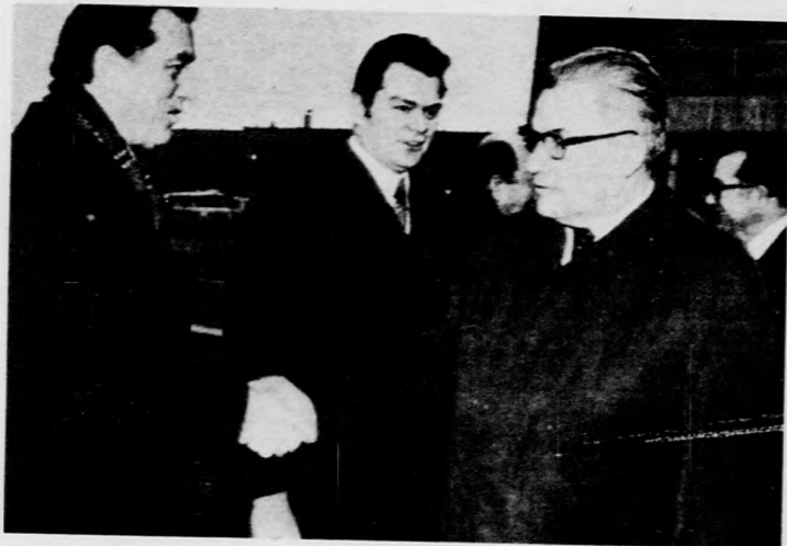
Puja Frigyes külügyminiszter Afrikába utazott. Hivatalos látogatást tesz Etiópiában, a Kongói Népi Köztársaságban, az Angolai Népi Köztársaságban, a Mozambiki Népi Köztársaságban és a Tanzániai Egyesült Köztársaságban. Búcsú- tatására a Ferihegyi repülőtérre megjelent Rác Pál kül- ügyminisztériumi államtitkár. Képünkön: Rác Pál búcsú- zik Puja Frigyesről