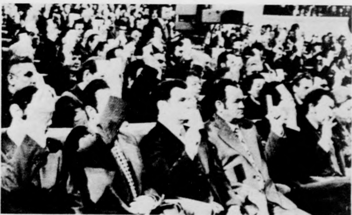
A küldöttek szavaznak

A külkereskedelemtől szólva a miniszterelnök rámutatott arra, hogy a népgazdaság fejlődése és korszerűsítése