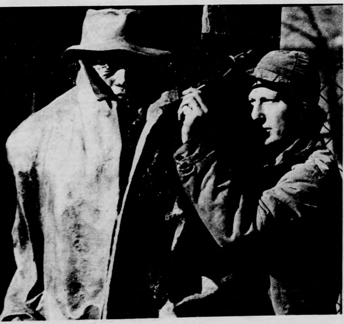
A szobor álló alakja öntés után