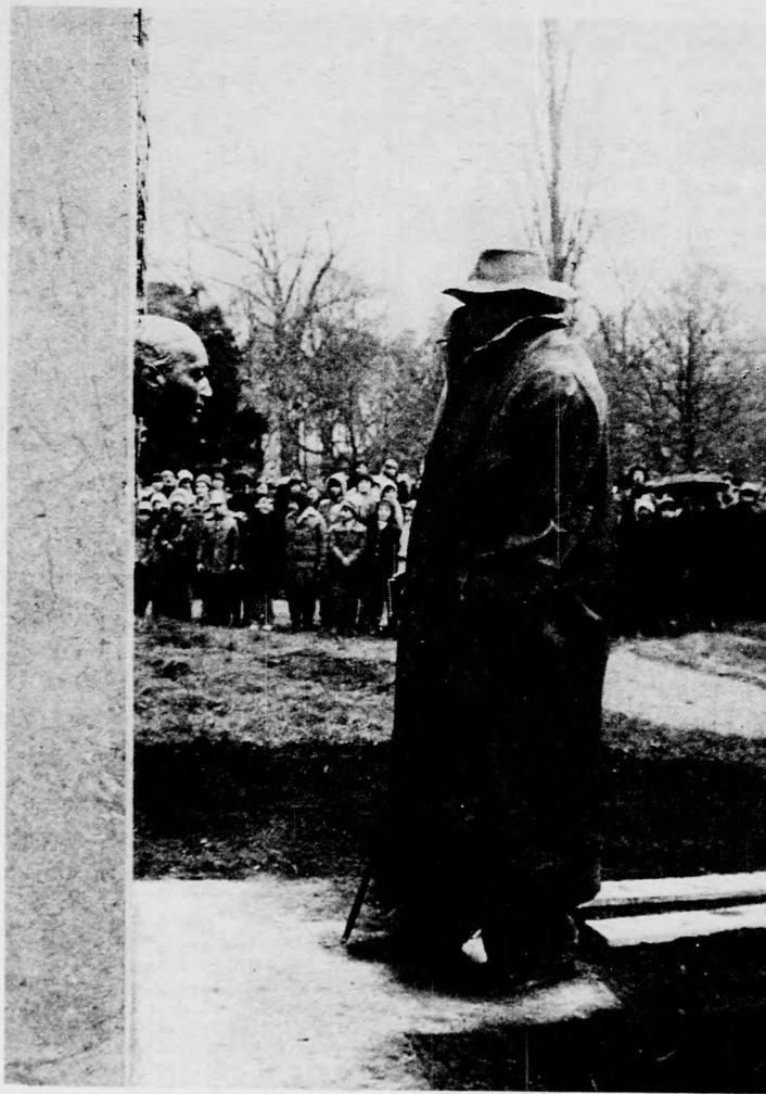
A Nagyerdőn felállított plasztika