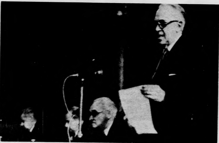
Szentágothai János, az Akadémia elnöke megnyitja az ülést

A Szovjetunió elismert tu- dományos potenciálja lehe- tővé tette számunkra, hogy a hazai kutatások műszaki bá- zisát és a rendelkezésre álló szellemi erőket megnöveljük — mondta egyebek között Márta Ferenc, az MTA fő- titkára a Magyar Tudomá- nyos Akadémia és a Szov- jetunió Tudományos Akadé- miája közötti együttműködé- si egyezmény megkötésének huszadik évfordulója alkalmából rendezett tudomá- nyos ülészek megnyitóján, kedden az MTA dísztermé- ben. A tanácskozást Szent- ágothai János, az MTA elnö- ke nyitotta meg, majd Márta Ferenc, az MTA főtitkára méltatta a két akadémia húszéves együttműködésé- nek jelentőségét és eredmé- nyeit. A kapcsolatok eredmé- nyességét jelzi, hogy míg 1958-ban az együttműködési egyezmény hét közös kutató- si témát jelölt meg, a jelen-