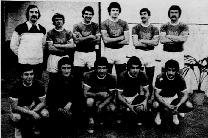
és a D. Dózsa