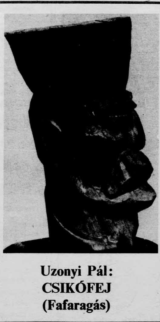
Uzonyi Pál: CSIKÓFEJ (Fafaragás)

A vasárnapi bemutató hegedű- szólamát ugyanaz az Erich Green- berg játszotta, aki az ősbemutatón a leeds-i fesztivál zenekarával együtt szólaltatta meg a művet. A zene- akadémiai bemutatón a Magyar Rádió és Televízió szimfonikus ze- nekarát Lehel György vezényelte. (MTI)