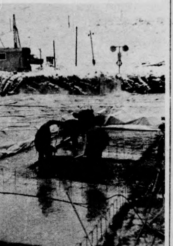
Egy-egy alap elkészítése a hídger miatt körülbelül 48 óras folyamatos betonozást igényel