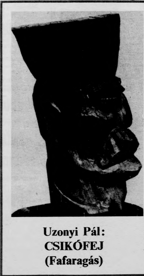
Uzonyi Pál: CSIKÓFEJ (Fafaragás)

A vasárnapi bemutató hegedűszólamát ugyanaz az Erich Greenberg játszotta, aki az ősbemutató a leedszi fesztivál zenekarával együtt szólaltatta meg a művet. A zeneakadémiai bemutatón a Magyar Rádió és Televízió szimfonikus zenekarát Lehel György vezényelte. (MTI)