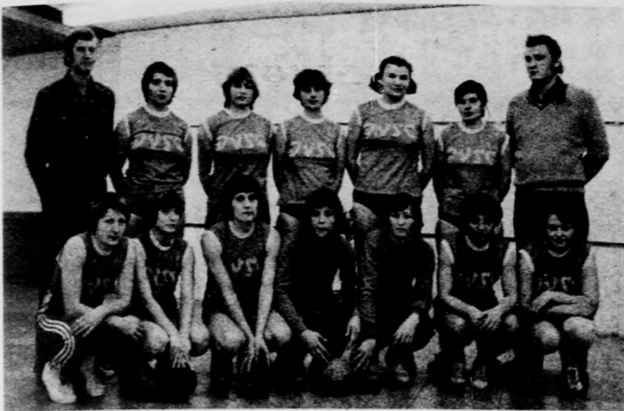
A városbajnok DVSC