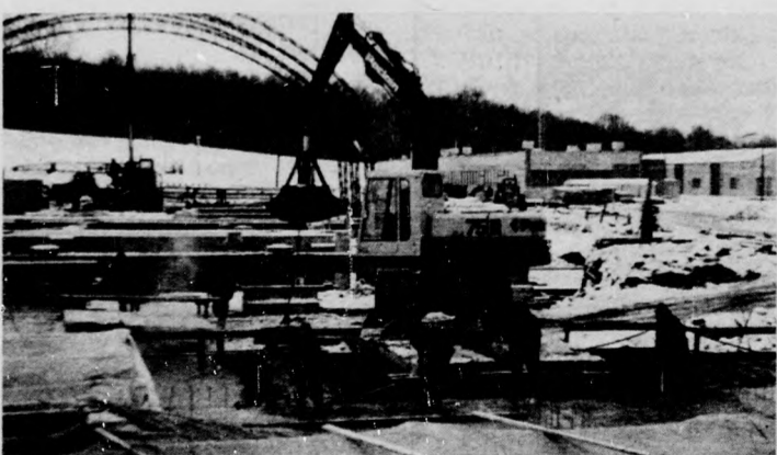
Túl az 1300. cölöpön

A Zbrucs-parti erdőirtáson lassanként kibontakozik az új iparbázis, az orenburgi gázvezeték gusztyyini kompresszor-állomása