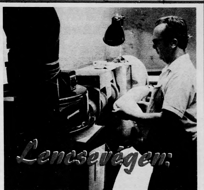
Gépek segítik a szolgáltatást a Vörös Hadsereg úti szalonban

A magyar-szovjet kapcsolatok egyik legdinamikusabb területét a gazdasági együttműködés. A Szovjetunió — minden szempontból legjelentősebb gazdasági partnerünk — rendkívül jelentős szerepet töltött be szocialista nagyiparunk megalapozásában, felépítésében, majd a hatvanas évektől kezdve korszerűsítésében is. A szovjet népgazdasággal létrejött kooperáció révén több modern ágazat — az alumíniumipar, a közúti járműgyártás, a petrokémia — kifejlesztésére nyílt módunk, mégpedig magas műszaki színvonalon. Az országaink között megvalósult széles kö-