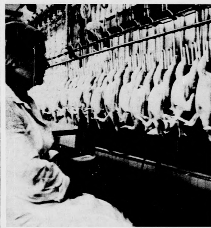
Naponta negyvenezer baromfi dolgozik fel a budapesti Baromfi-feldolgozó Vállalat budafoki üzemében

A szociális és kulturális alapok minden szövetkezetben milliós nagyságrendűek.