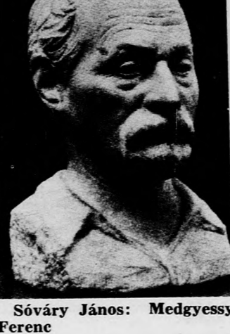
Sövény János: Medgyessy Ferenc

giai irányítása mellett fejlődött ki az 1920-as évek elején. A három mester közül leginkább Stróbl Alajos állott közel hozzá, aki ekkorra már túljutott az eklektika és a szecesszió buktaóin és szobrászata megtisztult patetikus és érzelmes vonásaitól. Már olyan szobrok alkotására volt képes, mint például az „Anyánk”. Sövény János több száz kiemelkedő, lélektanilag hiteles portrét alkotott, ezek közé tartozik a Medgyessy Ferenc is, akihez őszinte barátság fűzte. A szobrászatról valótlan nézetek is azonosok voltak. Medgyessy tömör formáinak letisztult mozdulatai és statikus mintázása megragadta Sövény képzeletét. Sövény János 1895. november 15-én született a Háromszék megyei Papolcon. Elemi iskoláit Kézdivásárhelyen és gimnáziumi tanulmányait Kolozsvárott végezte, míg Budapesten fejezte be. Nyugatalan vére azonban Amerikába úzte, élt Rio de Janeiróban és Philadelphiában. Megélhetési gondjai arra kényszerítették, hogy bármiféle plasztikai megbízást elvállaljon: dolgozott műkereskedőknek, kerámiai terveket készített és a merőben idegen amerikai környezetben is elérte, hogy kisebb igényű feladatok vállalásával jó nevet vívjon ki magának. De a honvágy hazahozta Magyarországra. Néhány évi