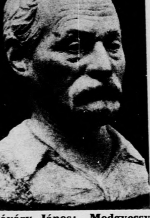
Sóváry János: Medgyessy Ferenc

Jó évtizede már annak, hogy Sóváry János 1966. március 5-én meghalt. E méltánytalanul elfelejtett szob- rász az elmúlt évtizedekben plasztikának élvonalába tar- tozott. Bennünket azért is ér- dekelhet közelebbről Sóváry János művésze, mert pályá- jának egyik kiemelt alkotása barátjáról, Medgyessy Fe- rencről készült portréja. Szinte érthetetlen, hogy mű- ködésekének értékelése meny- nyire elkerülte a műtörténe- szek figyelmét, akárcsak hú- gának — művésznévén Cori- ni Margitnak —, külföldi el- ismerését is kivívott festésze- te.