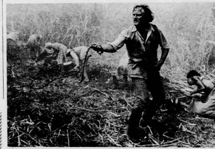
FÉNY AZ AKASZTÓFÁN

Vetítik: Apolló február 23-26-ig délután, Meteor február 28-tól március 1-ig, Vig február 23-tól 28-ig délután. Szines szovjet film A sólymok vezetője . A történet 1944 őszén játszódik, amikor Ukrajnában még folynak a harcok a nacionalista bandákkal. Vetítik: Apolló február 27-től március 1-ig délután, Horváth Árpád február 23-24-ig, Klinika február 26-án, Meteor 23-26-ig, Vig február 27-től március 1-ig délután.