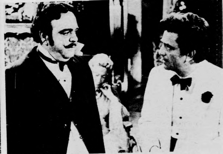
A NYOLCADIK X