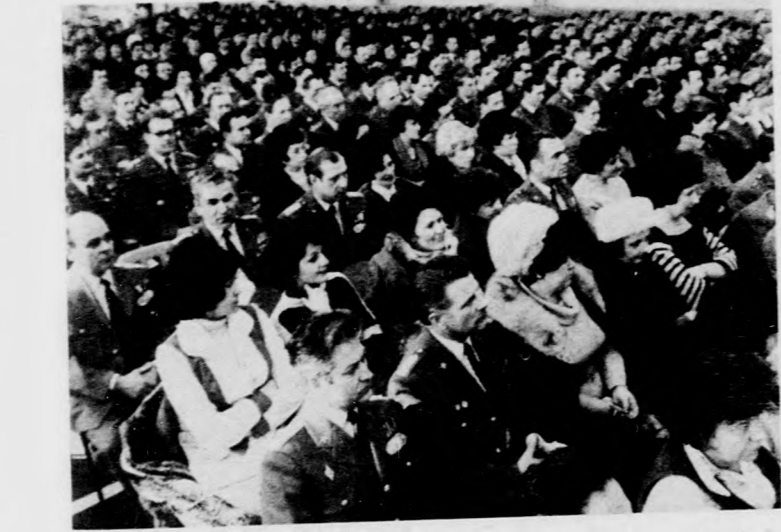
Az ünnepség résztvevői

A szovjet hadsereg megalakulásának 60. évfordulójára tiszteletére ünnepséget rendeztek Debrecenben, a Kosuth lakótelepen.