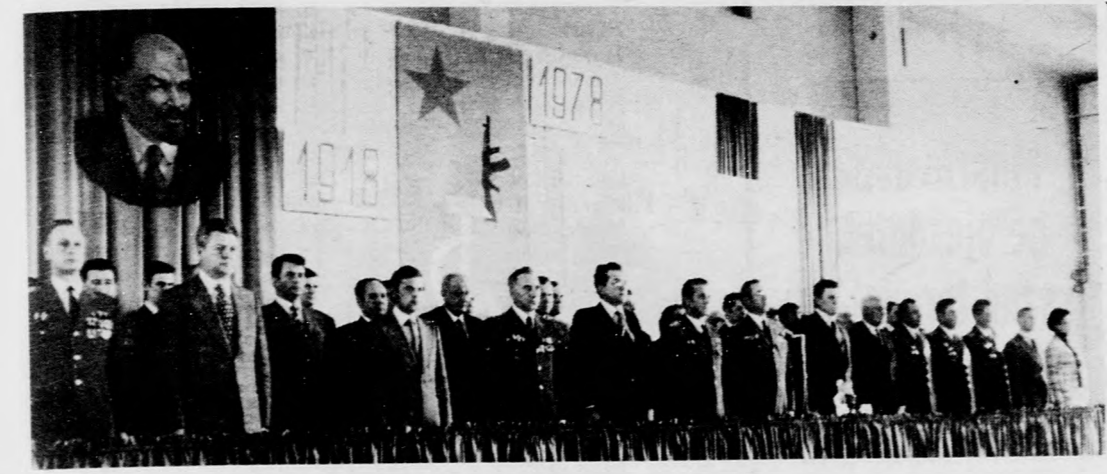
Az ünnepség elnöksége

1978. február 22-én született meg a KISZ Hajdú-Bihari megyei bizottsága. A bizottság feladatait, és megválasztotta a munkára bízottakat. Ezzel a küldöttgyűléssel a szervezési és a személyzeti kérdések