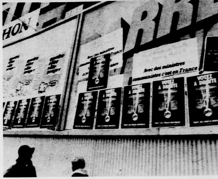
Az utcákat ellepő plakáttenger bizonyítja: Franciaországban teljes gőzzel folyik a választási kampány

BERLIN. A Demokrátikus Ifjúsági Világszövetség X. közgyűlésén kedden, Berlinben, a regionális és tematikai bizottságok üléseinek befejeztével ismét plenáris ülésen folytatták munkájukat a küldöttek.