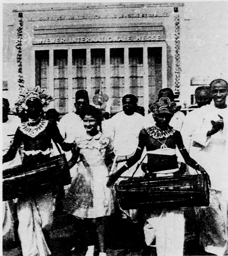
A harmadik világ országaiak küldöttei Bécsben

A sajtótájékoztatón dokumentumokkal bizonyították, hogy számos szervezet nagy erőfeszítéseket tesz a találkozó meghiúsításáért. A Hajdú-bihari Napló egyik július eleji tudósításában is olvasható, hogy „lapjelentések szerint Majna-Frankfurtban a bonni kormány anyagi és politikai támogatásával központi szervezett zavaró akciók összehangolására. A központi