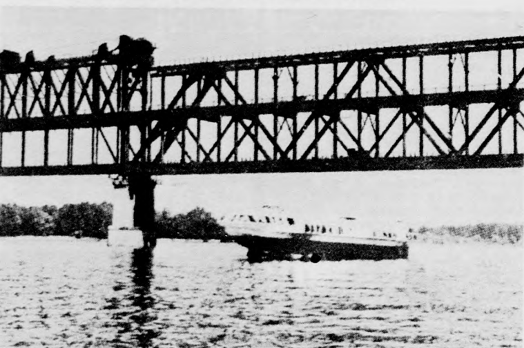
Rusze egyik legnevezetesebb objektuma: a Barátság hídja, mely Bulgáriát és Romániát összeköti