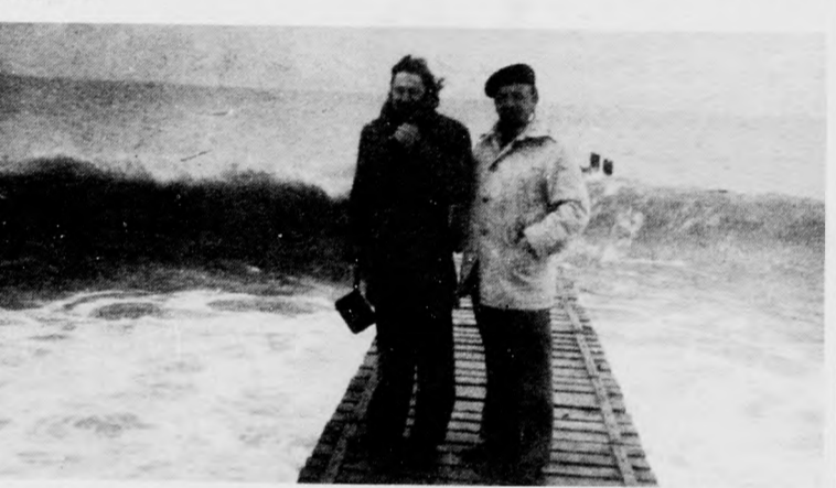
A háborgó tenger Várnában

azt is tudtuk, hogy a városban jelentős Kossuth- emlékek vannak.