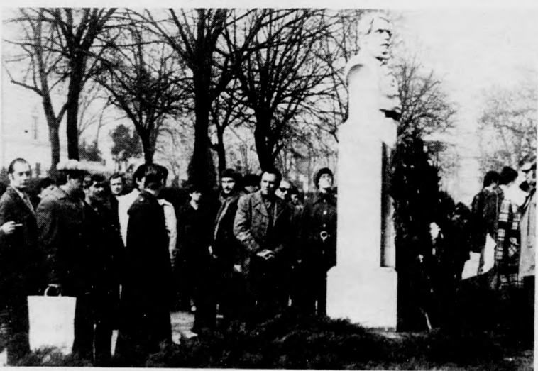
A zenekar tagjai megkoszorúzzák a sumeni Kossuth-szobrot

A hatalmas hegyek völgyében megtelepült Sumenre mindannyian felfokozott érdeklődéssel vártunk, lévén Debrecen testvérvárosa, de