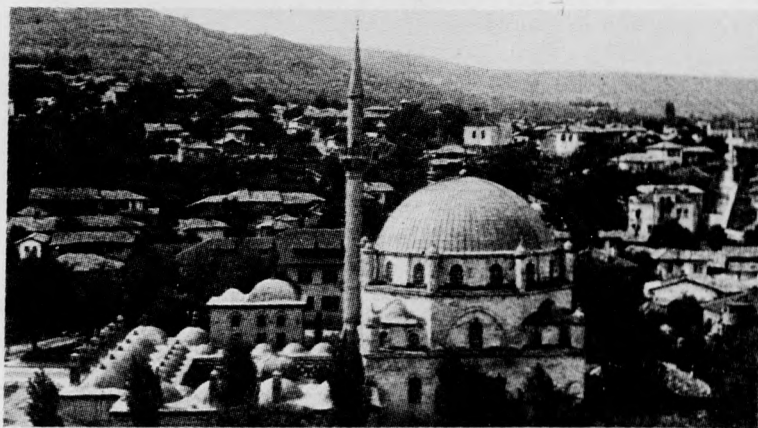
Sumen lát képe, előtérben a Tombul-dzsámi