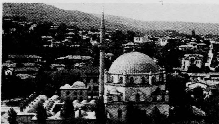
Sumen látképe, előtérben a Tombul-dzsámi

Vasárnap, március 26-án délelőtt indult a társaság vissza Várnába. Az idő hidegre fordult, a hegyekben esett a hó, s vastagon betértette az út menti lejtőket. Sumen körül hóvihár tombolt, csak Várna felé közeledve enyhült valamelyest az idő.