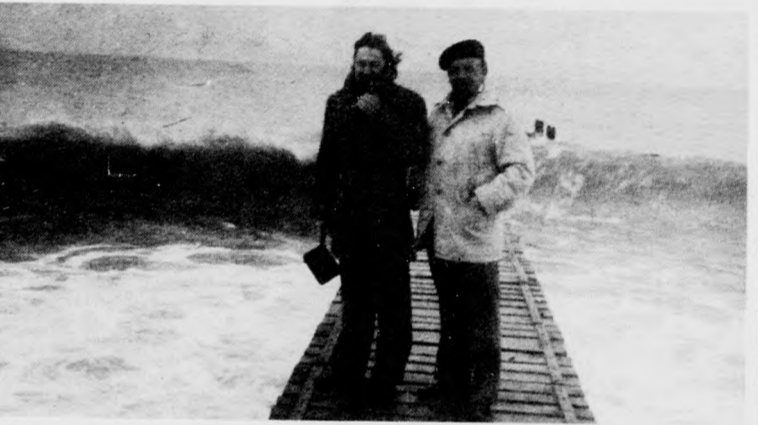
A háborgó tenger Várnában

Vasárnap, március 26-án délelőtt indult a társaság vissza Várnába. Az idő hidegre fordult, a hegyekben esett a hó, s vastagon betértette az út menti lejtőket. Sumen körül hóvihár tombolt, csak Várna felé közelítve enyhült valamelyest az idő.