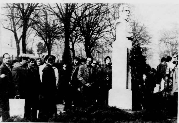
A zenekar tagjai megkoszorúzzák a sumeni Kossuth-szobrot