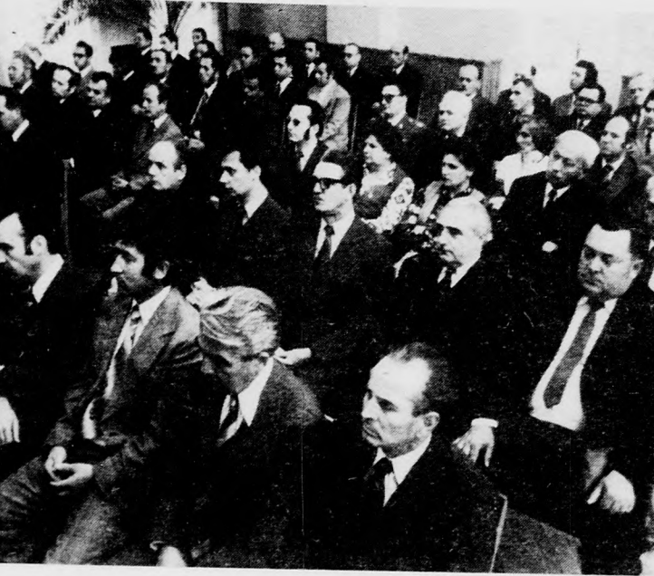
Az ünnepségen részt vevő propagandisták egy csoportja