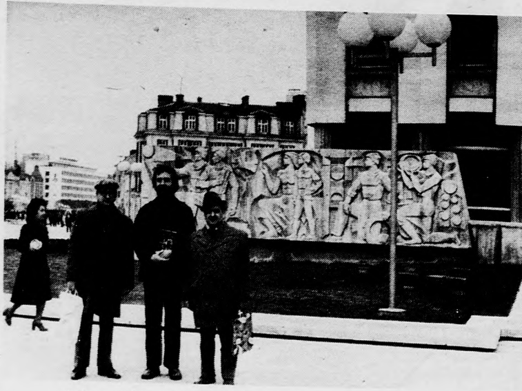
Városnéző sétá közben