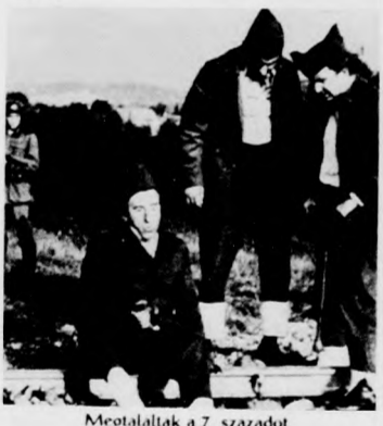
Megtalálták a 7. századot

Megtalálták a 7. századot — tudósítja a színes szinkronizált francia filmvígjáték azokat a nézőket, akik látták a Hová tűnt a 7. század? című filmet is. Robert Lamoreux alkotását az Apolló moziban május 11-14. között negyed tiztől és negyed kettőtől, fél négytől, háromnegyed hatától és nyolctól, a Meteorban május 11-13. között délután három, negyed hat és negyed nyolc órai kezdettel, a Vigben május 15-17-én délután háromnegyed hat, negyed kilenc órai kezdettel, a Horváth Árpádban május 14-én vetítik.