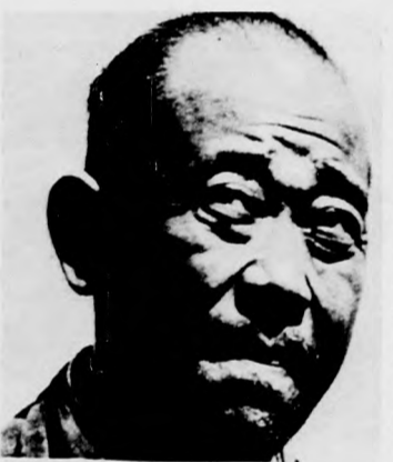
A KOPÁR SZIGET

Ujra láthatják a nézők az annak idején nagy sikerrel vetített A kopár sziget című japán filmet. Kaneto Szindo alkotását a Művész moziban május 11-12. között fél nyolc órai kezdettel, a Klinika moziban május 15-16. délután öt órai kezdettel vetítik. Ugyancsak japán alkotás a Ciszás Kandúr a világ körül című színes, szinkronizált rajzfilm. A művet — Hiroši Sidar rendezése — az Apollóban május 11-14. között délután fél ketőtől, május 15-17-én délután fél nyolc órai kezdettel, a Klinika mozijában május 14-én délután öt órai kezdettel, a Meteorban május 14-17. között del-