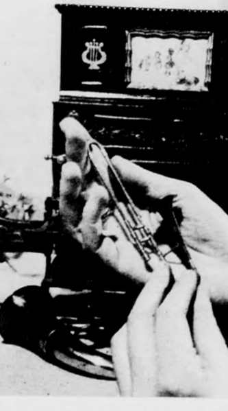
A Magyar Nemzeti Múzeum újkori osztályán a hagyományos hangszerek mellett különleges, mini hangszerek is helyet kapnak.

A KEDVEZŐ IDŐJÁRÁS hatására a debreceni szőlőskertekben gazdag volt a fakadás, és a levelet is gyorsan növekedik. A téli fagyok nem tettek kárt a szőlőkben sehol.