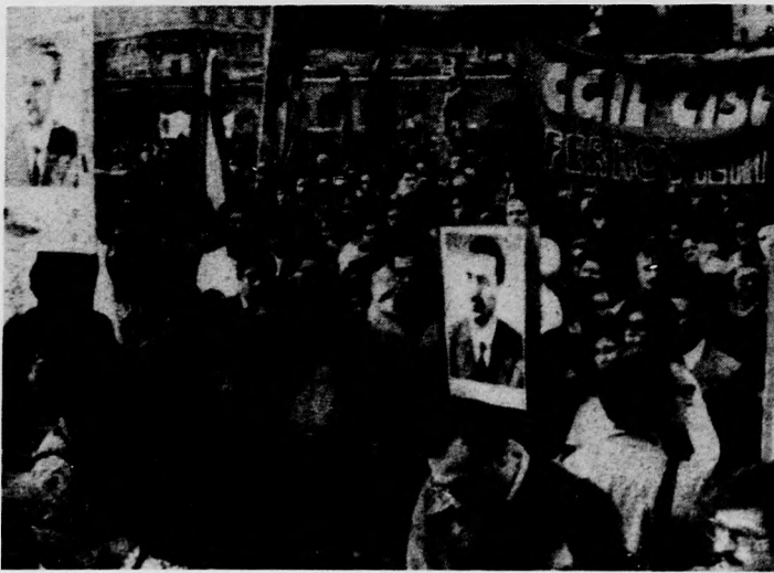
Az olasz szakszervezetek Rómában tömegtüntetésen emlékeztek meg a meggyilkolt Aldo Moróról

Ezt követően titkos szavazással az Akadémia alelnökévé Fülöp József akadémikust, az elnökség tagjává pedig