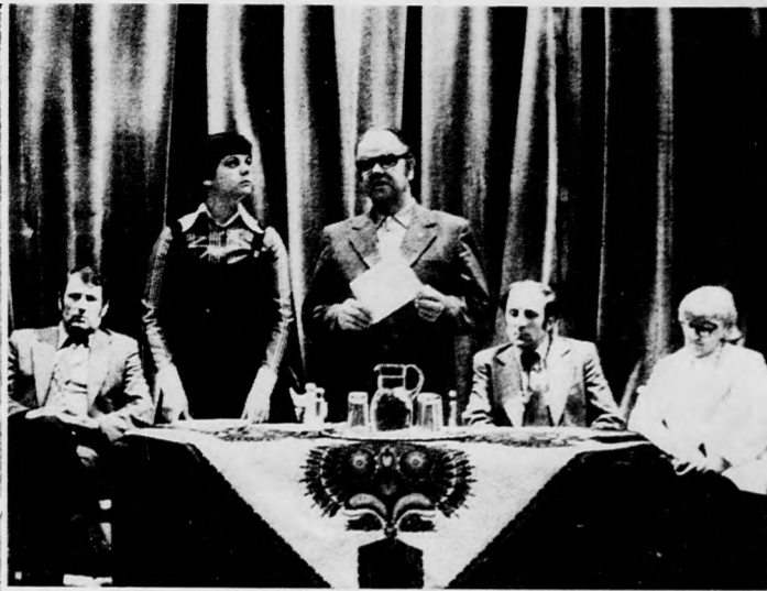
A svéd testvérpárt küldötte előadást tart a Déri Múzeum- ban

A versenynek is köszönhe- tő, hogy megyénkben tavaly a vártnál is nagyobb mértékű növekedést értünk el: a tej- termelés 9 százalékkal, a fel- vásárlás pedig 14 százalékkal haladta túl az előző évi szin- tet. A termelés elérte a 150 millió litert, a felvásárlás 111 millió liter volt.