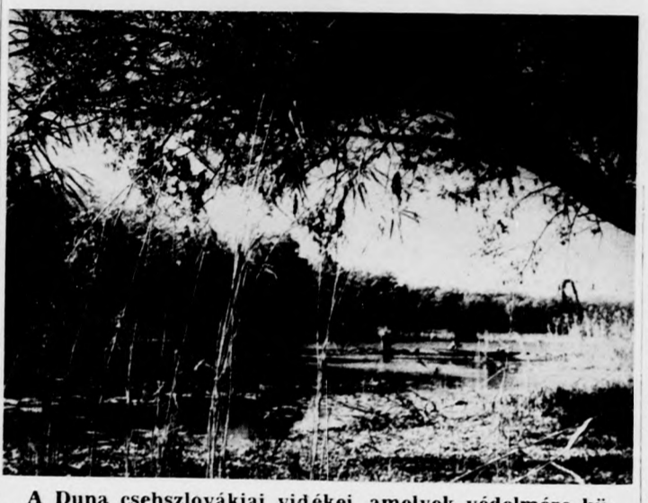
A Duna csehszlovákiai vidékei, amelyek védelmére külön terv készült

A Duna Gabcikovo és Nagymaros közötti szakaszán létesítendő erőművekről szóló magyar-csehszlovák egyezmény értelmében — amellyel, hogy 1986-tól az erőművek bekapcsolódnak a két ország energetikai rendszerébe — gondoskodni kell a környék természeti értékeinek megővéséről is. A környezetvédelem napjaink egyik legfontosabb feladata — a megállapodás ennek megvalósítására mindkét ország számára külön intézkedési tervet tartalmaz. A számítások szerint a vízlepcsős-rendszer üzembe helyezésére a Csallóköz felső részén, ezen a jól termő gabonaföldön a talajvíz két-három méterrel emelkedik majd. Szabályozására a központi áteresztő csatornán több zsilipet létesítenek,