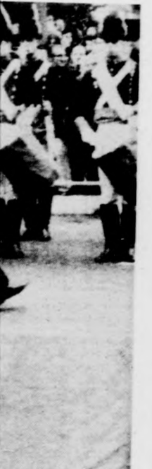
nemzeti ünnep- évfordulójáról. pségen. Balról a fotó.

vüli hatáskörrel „szocialista fő- zombaton indítja gálatot azok ellen, ban hivatalosan mi nép nemzeti és reljai ellen tevé- ek” neveznek. b, a vizsgálatot egész Egyiptom gei útján távirat- ra fel hazatérésre rgó írókat és új- főügyész a vizs- parlament elé elentését. (MTI)