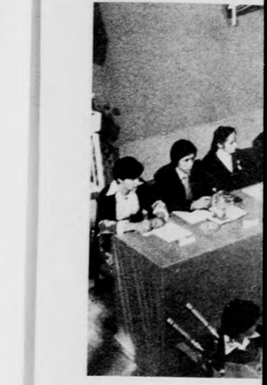
Matkó István meg...

BUDAPEST, 1. MŰSOR 7.59 Műsorismertetés. 8.00 Idősebbek is elkezdhetik... 8.05-8.30 Iskolatévé. 8.30 Arséne Lupin. (Francia film sorozat ism.) 9.20 Kamera. 9.50 Mindenki közlekedik... 10.05 Természetbarát. 10.25 „S mindenkinek szerep van...” (ism.). 12.00-12.30 Malom. Utazási vetélkedő. 14.17 Műsorismertetés. 14.20 Apák és fiúk. (Angol tévéfilm.) 15.05 Az első év merle-ge. 15.35 Idecsú! Ajánlóműsor gyerekeknek. 16.00 Fiatallalások... 17.00 Hírek. 17.05 Dicsőítő. Ráport-dokumentumfilm. 17.40 Reklám. 17.45 Fűben, fűben orvosság van? Ráport-műsor. 18.15 Vihar Béla: Egy katonája megy a hóban. 18.35 Könyvsátor. 18.45 Egymillió fontos hangjeggy. 19.05 Reklám. 19.15 Cicaúzó. 19.20 Idősebbek is elkezdhetik... 19.30 Tv-híradó. 20.00 Táncoj még! Szűcs Judit műsora. 20.25 Földünk és vidéke. Tevéjáték. 21.55 Tv-híradó 3. 22.05-23.45 Ingrid Bergman-sorozat. Forgószél. (Amerikai film.)