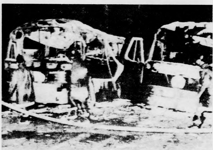
A mexikói fővárostól mintegy 85 kilométerre felrobbant egy folyékony gázt szállító tartálykocsi. A kizúduló tüzes lángra lobbantotta az autópálya gépkocsijait, autóbuszait és az utat szegélyező házakat. A halálos áldozatok és a súlyos sebesültek száma meghaladja a kétszázat