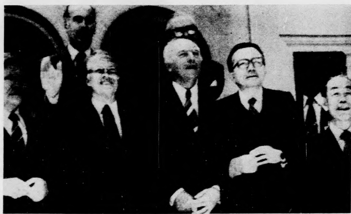
Közös közlemény aláírásával befejeződött Bonnból a tőkés világ gazdasági csúcskonferenciája, amelyen Franciaország, Anglia, az NSZK, Olaszország, Japán, Kanada és az Egyesült Államok állam- és kormányfői vettek részt

A tervezett dokumentum első része átfogó, általános jellegű lesz és mind a hét részt vevő országra vonatkozik. Ezt követően külön fejezet foglalkozik a Japánra, a Közös Piac egészére, valamint külön-külön az NSZK-ra, Nagy-Britanniára, Franciaországra, Olaszországra és külön az Egyesült Államokra vonatkozó problémákkal. Ezt a témakört vasárnap délelőtt már megvitaták, a végleges szöveget a szakértők dolgozzák.