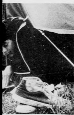
pihenő a tábort

NET lesz 1978. július 16-00 óráig a Kische- arlatlan oldalán a vas- tól kifelé a Diófa borotya utcán a Kis- földi végén. (X)