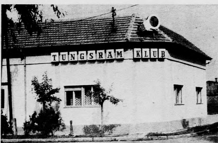
A Tungsram-klub épülete

A mostani jelentkezések azt bizonyítják, hogy nagy az érdeklődés az új felsőoktatási intézmény iránt; a nappali és az esti tagozatra több mint kétszeres, a levelezőre négyszeres túljelentkezés volt. A lezajlott felvételen magasak voltak a követelmények; a három tagozatra pályázott 1293 államigazgatási dolgozó közül 450-en kezdik meg tanulmányaikat a Menedi úti főiskolán. (MTI)