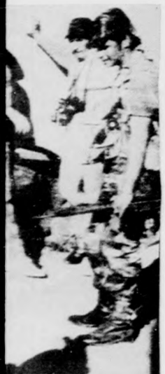
biztonsági egysé- enné faluban még roltak

fón, mielőtt elt- t kijelentette: a zraeli béketerve- k a legújabb ja- dott át Weizman külügyministe- kérdésekről, a évő Begin—Sza- ik, hogy Szadat bekelet bocsátotta is, továbbá haj- eddig két háború- nyult. Márpe- keleti tartós és