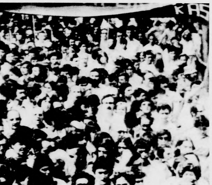
A baszkföldi San Sebastianban vasárnap többezren tüntettek a rendőrség brutalitása ellen

MOSZKVA. Az SZKP Központi Bizottsága, a Szovjetunió Legfelsőbb Tanácsának Elnöksége és a Szovjetunió Minisztertanácsa mély megrendüléssel tudatta, hogy július 17-én, életének 61. évében elhunyt Fjodor Kulakov, a kiemelkedő párt- és állami vezető, az SZKP KB Politikai Bizottságának tagja, a Központi Bizottság titkára, a Szovjetunió Legfelsőbb Tanácsának küldötte, a Szocialista Munka Hőse.