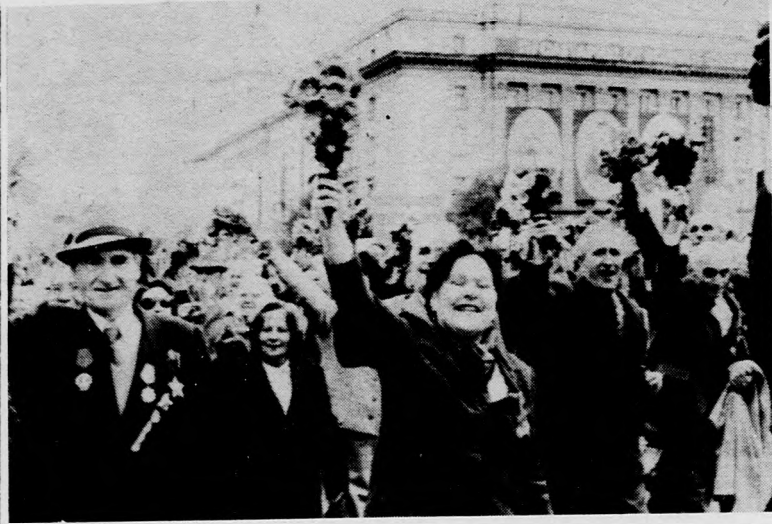
Bulgária nemzeti ünnepe alkalmából nagyszabású, színpompás felvonulás színhelye volt a bolgár főváros, Szófia