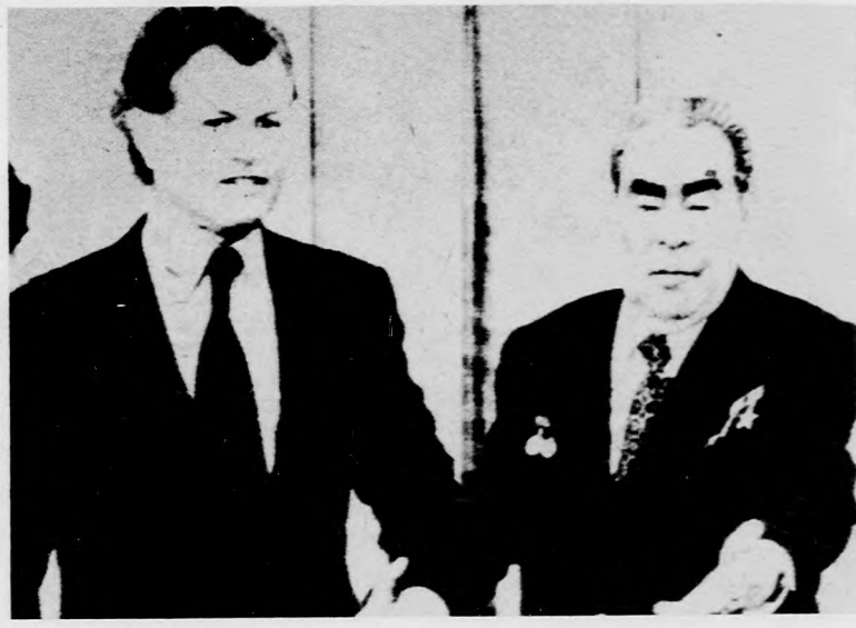
Edward Kennedy amerikai szenátor vasárnap reggel elutazott Moszkvából. Ötnapos látogatása alatt részt vett Alma-Atában egy nemzetközi kongresszuson, majd Moszkvában találkozott Leonyid Brezsnyevvel, az SZKP KB főtítkárával, a Szovjetunió Legfelsőbb Tanácsa Elnökségének elnökével

Egy olyan Afrikában, amelyre éppen most az a jellemző, hogy a neokolonialista hatalmak igyekeznek megszállítási megingott pozícióikat, az etióp fejlődés jelentősége túlnó az ország tágas határain.