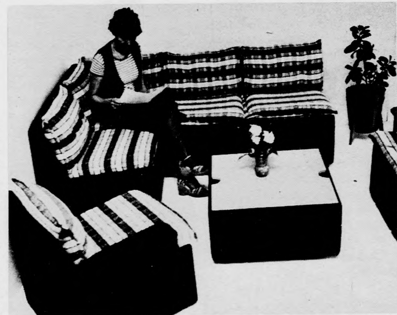
Egy szép garnitúra

szen ők a világ első belsőépítészei — de mi — hozzá kell tenni — „dömpingszéket” szállítunk oda.