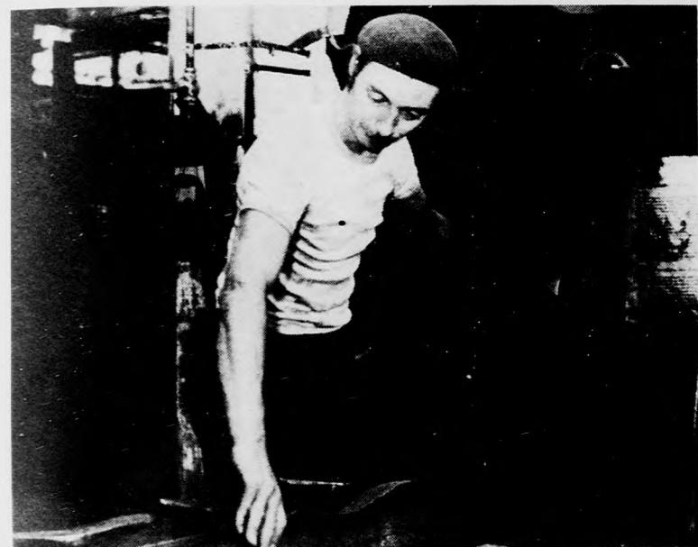
A sablonokban kívánt méretre hajlítanak

Az idei őszi Budapesti Nemzetközi Vásáron a szocialista országok bemutatóját az idegenforgalom és turizmus szektorában igénybe vett 95 négyzetméteres kiállítási terület teszi teljessé. Itt elsősorban információs irodákat állítanak fel az idegenforgalom, turizmus fellendítésében érdekelt, a témával foglalkozó vállalatok.