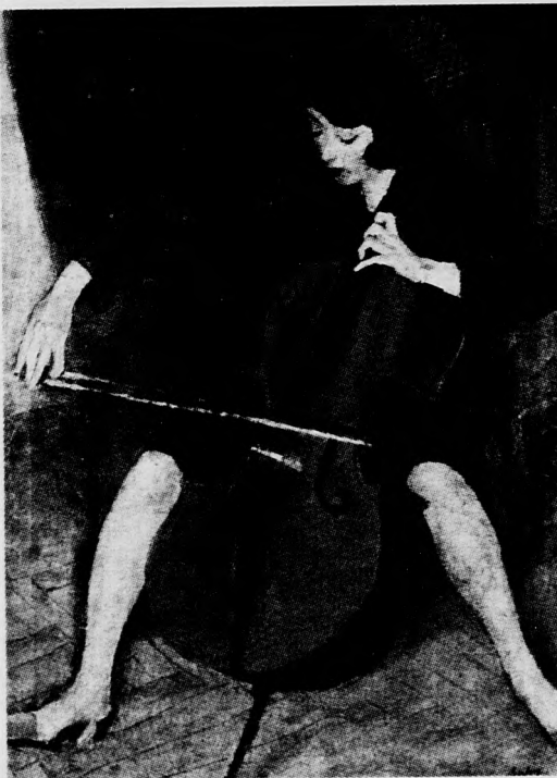
Berény Róbert: Csellózó (1927)