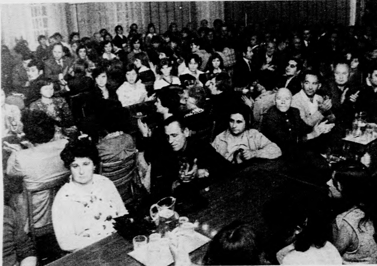
A nagygyűlés résztvevőinek egy csoportja