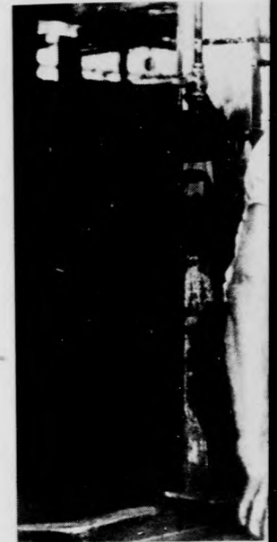
A sablonokban kiváltó

— Tudja, ez a hüvő jót tett nekünk. Nekün