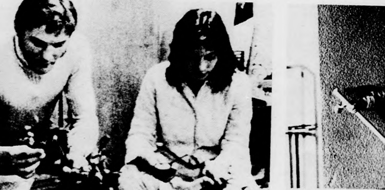
FAGYÖNGYÖK Magyar dokumentumfilm. Rendezte:EMBER JUDIT. POKOLI TORONY

Ember Judit új magyar dokumentumfilmje, a FAGYÖNGYÖK , amely a héten kerül a filmszínházak műsorára. Részlet Vársárhelyi Miklós dramaturg cikkéből: „Fagyöngyök. Kepek egy munkásszálló életéből. Nagyon egyszerű, ezért igazak, őszinték és hitelesek. Amennyi pátosz, érdekesség, különös árad belőlük. Mert minden dramaturgia, szerkesztési elemény nélkül milyen izgalmas és lenyűgöző az egyszerű ember mindennapos életé, milyen megragadó a küzdelme a kis dolgok megvalósításáért. Csak meg kell lenni a fagyöngyöt, amelyet szürkületben szednek, éjszaka kötnék, hajnalban értékesítnek: a titkokat, amelyek feszítik és összekövik a fagyöngyök, mozgatják és stabilizálják, fölbolygatják és kiegyensúlyozzák a közösségi életet.” Vetítik: Agrártudományi, szeptember 25-én, Apolló, szeptember 25-27-ig délután, Horvát Árpád, Meteor, szeptember 25-27-ig. A nagyszerű, színes szöveget film felújításban kerül a nézők elé. A Samisjev által rendezett film címe: A sziklabarlang titka . Vetítik: Apolló, szeptember 25-27-ig délután, Horvát Árpád, szeptember 24-én, Klinika, szeptember 21-én. Egy felhőkarcolóban keletkezett tűzvesztről szól a Pokoli torony című színes, amerikai film, amelynek több szerepét Paul Newman és Steve McQueen játszották. Vetítik: Vig, szeptember 21-től október 11-ig.