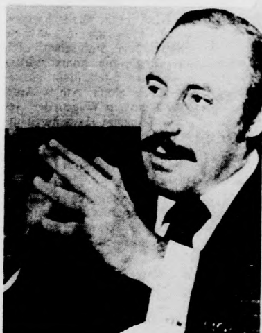
A bombamerénylet áldozata, Orlando Letelier volt chilei külügy- és honvédelmi miniszter

Most Contreras tábornok bizakodik, s talán nem is alaptalanul. A Spiegel című nyugatnémet lap értesülése szerint a tábornok április elején 14 kézitáskával Punta Arenas kikötővárosba utazott. A táskák feltehetően a DINA korszakából való akarták tartalmazták. A csomagokat a Badenstein nevű nyugatnémet hajóra vitték, amely április 20-án Európába indult. A hajóársaság egyelőre tagadja, hogy a szállítmányt felvette.