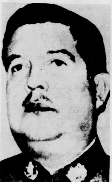
Manuel Contreras tábornok. A vád: gyilkosságra való felbujtás

Az amerikai államügyész ezt követően Townley kiadatását követelte. Townley eleinte bizakodott, hogy a chilei hatóságok, akiknek