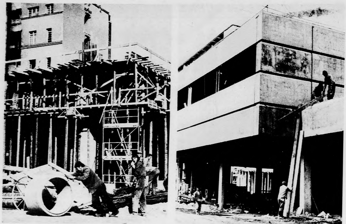
A leendő OTP-fiók Az épülő áruház