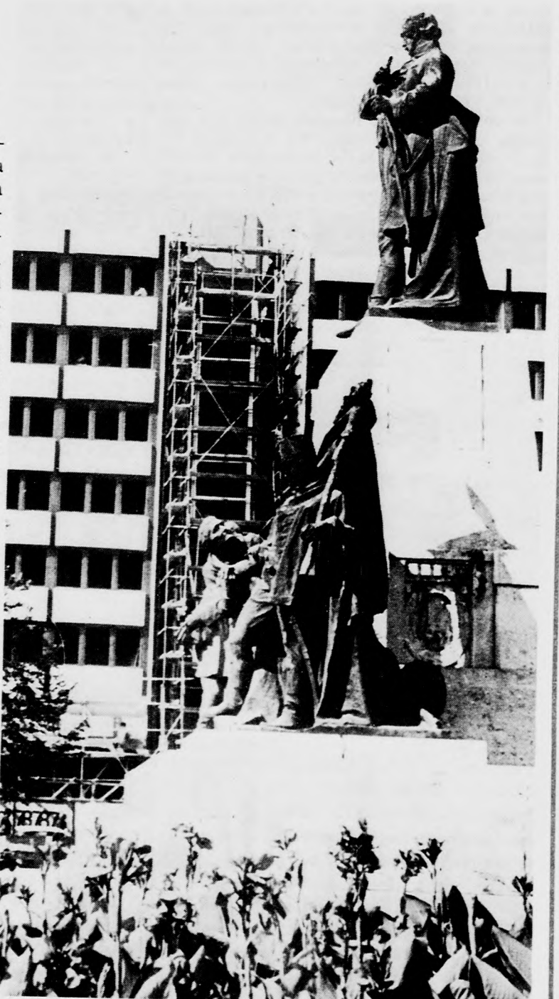
Háttérben a 75 lakásos lakóház