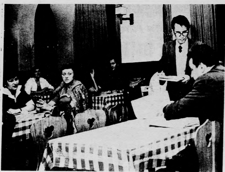
Értékelik a versenyt

a zöldbab 12-20, a zöldbor-só 20-25, a gomba 30-80, az alma 5-14, a körte 6-18, a birsalma 6-12, az őszibarack 4-18, a sziva 3-7, a földi-eper 60, a málna 30-36, a szőlő 10-25, a görögdinnye 4, a héjas dió 20-30, a dióbél 120-130, a mogyoró 80-100, a mák 38-45, a méz 45, a savanyúkáposzta 14 forint kilónként. A baromfi piacon az élő csirke 32-45, az élő tyúk 30-40, az élő liba 32-36, az élő kacska 32-44 forint kilónként. A tejfől 48-50, ugyanannyi a tehéntúró. A tojás darabja 1,80-2, a hal 27 forint kilogrammonként. A zeller darabja 1,50-3, a zöldhagyma csomója 3-4, egy fej saláta 2-5, a retek csomója 2-4, egy cső zöld tengeri 1,50-2,50 forint.