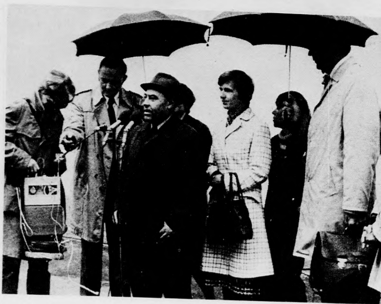
Romenszkij elvtárs köszönti a delegációt

És hogy Moszkva kulturális életéből is mutasson valamit, abban a szerencsében volt része a küldöttségnek, hogy a Kongresszusi Palotában végignézhették Borogyin Igor herceg című operáját.