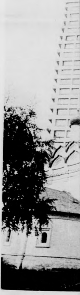
Felhárcoló és ha Nagy érdeklődés képriportja)

Katonazenével fogadta Moszkva a Szovjet-Magyar Köztársaság elnökségét szöngött a küldetésre indult nézésre indult. néznivaló bőven rös tértől a Len gígjárták a tize gépkocsiktól her utakon a szovje közel ezeréves még itt-ott előf zaktól a klasszik tesztli stíluson modern harri üveg- és betonpa den megtalálható. Moszkva az o szül. Befejezéshe az olimpiai obje szen az 1979. év spartakiádra miz sen kell állni. A denhol fiatalítják zák. Első nap de tették meg a nemzetközi me gép-kiállítás, am szág vett részt. A kiállítás te nem vállalhatta, lító országok m nbeli gépet ber minden mezőgazd ágból egy-két kon gon felüli teljesi pet bemutattak. szakemberek két is érdeklődéssel meg a kiállítást és meg a látottakat. És hogy Moszkva életéből is mutass abban a szerencsét sze a küldöttségne Kongresszusi Pal gignézheték Boró herceg című operá