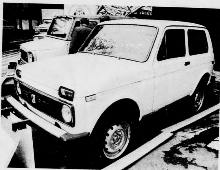
A kiállítás egyik érdekessége az 1600 köbcentis, négykerék-meghajtású Néva terepjáró személygépkocsi