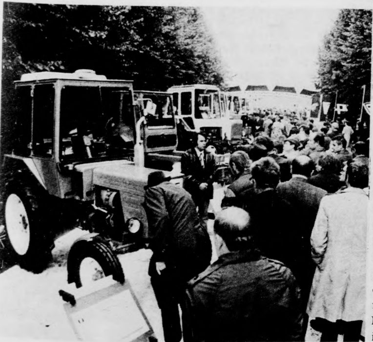
Nagy érdeklődés a szovjet erőgépeknél