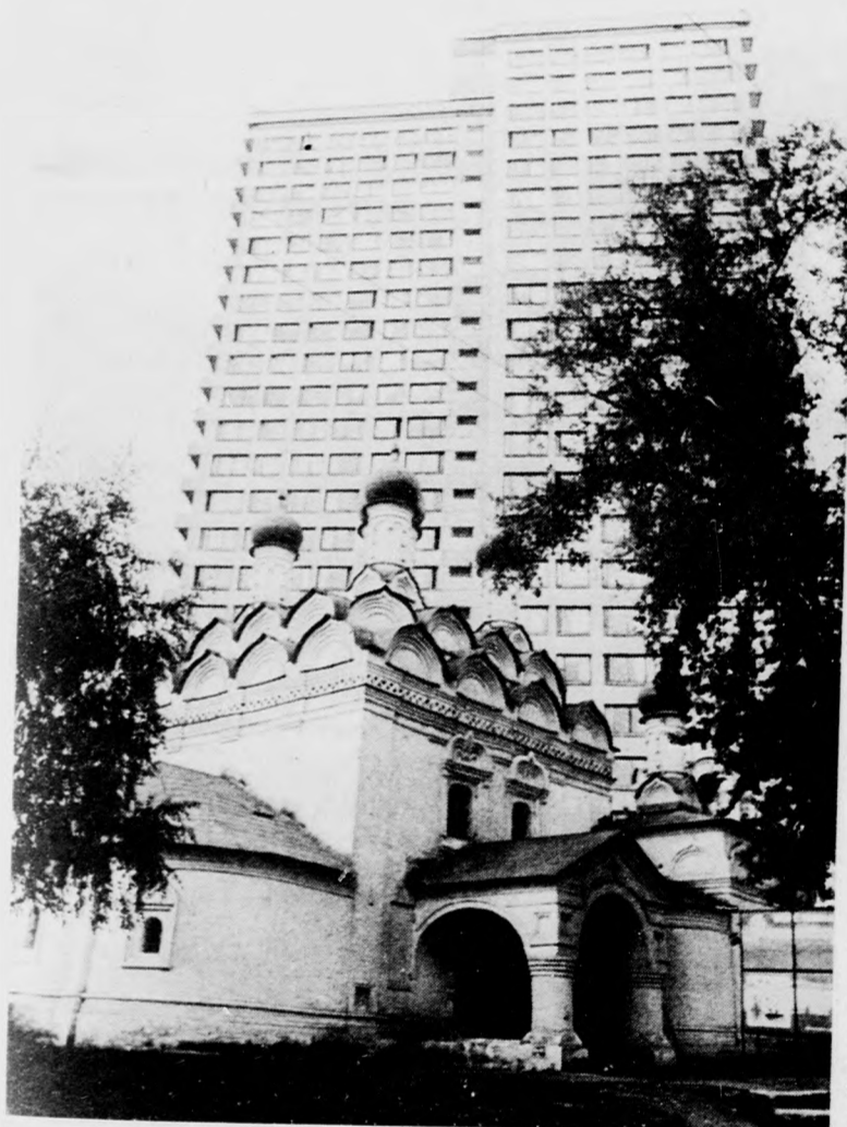
Felhőkarcoló és hagymatornyú templom