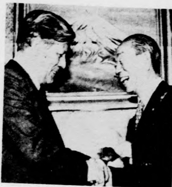
Helmut Schmidt nyugat-német kancellár Fukuda Takao japán miniszterelnök társaságában