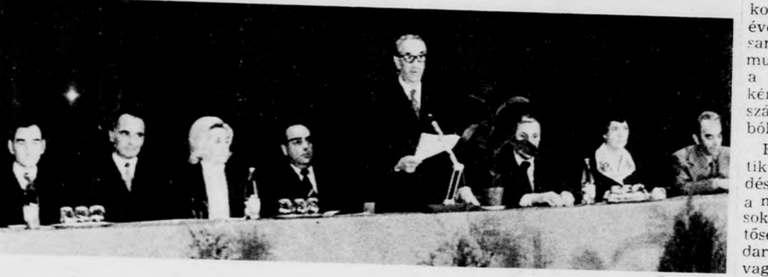
A vándorgyűlés elnöksége