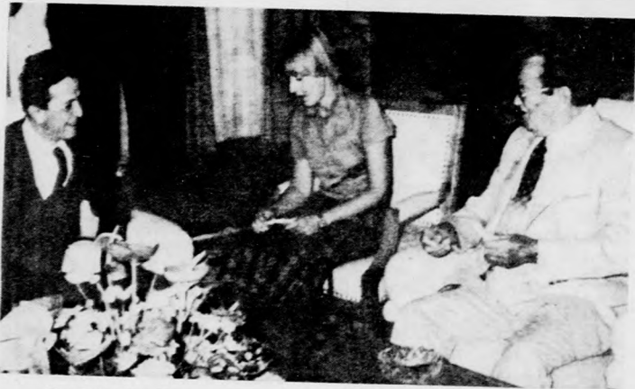
Enrico Berlinguer moszkvai látogatása befejeztével Jugoszláviába utazott. Képünkön: az Olasz Kommunista Párt főtitkára Tito elnökkel