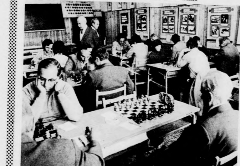
A Magyar Sakkszövetségben elkészítették a megyei bajnoksapatok körmerkőzéses csoportbeosztását. Hajdú-Bihar sakkcsapatbajnoka Gyöngyösön küzd majd az NB II-be jutásért. A csoportba Békés, Heves, Nógrád és Szabolcs-Szatmari csapatok kerültek. Megyénkben örvendene most az utóbbi években a megyei bajnokságban résztvevő csapatok száma. Felvételünk a D. Honvéd Bocskai-Nádudvar mérkőzésen készült.

1. e4 (Karpov tehát újra lemond az utóbbi években alkalmazzott kezdő lépéséről) 1. e4-ről) 1... Hf6, 2. Hc3, d5 (Korcsnoj a korábbi játszmákban e5-öt húzott, úgy látszik a megnyitások variálásával akarja megakadályozni, hogy Karpov előkészített változattal lépje meg.) 3. cd5, Hd5: 4. g3, g6 5. Fg2, Hc3: 6. bc3: Fg7 7. Hf3, 0-0 (Élesebb folytatás világgossal 7. h4, Karpov a szolidabb elágazást választja) 8. 0-0, c5 9. Bb1, Hc6 10. Va4, Ha5 (A huszár a tábla szélére kerül, de így módja nyilván sötétnek a nagytölt megállítására.) 11. d3, b6 12. Vh4,