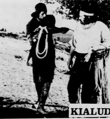
KIALUDT TÜZEK FÉNYE

Megrázó színes argentin film a csavargó lány. A kis Raulito egy tétécs-anya és egy alkoholistá apa lánya, akit idegzsán-tóriumba zárnak különös viselkedése miatt. Kitérés kísérlet rendre kudarcot vallanak, s amikor egy nánál is számkivetettebb sorsú kistúra talál, értelme támad életének, de a bukás elkerülhetetlen... A Klinika moziban október 13-án, az Agrártudományi Egyetemen október 16-án mutatják be. Abe Kóbi Nobel-díjas regényének japán filmváltozata A homok asszonya ismét műsoron lesz a stúdióhálózatban. A Klinika moziban október 17-én vetítik, a Művész mozi október 12-től 15-ig mutatja be.