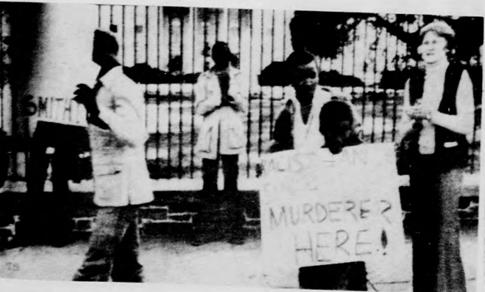
2 HAJDÚ-BIHARI NAPLÓ — 1978. OKTÓBER 12.

Tüntető tildokznak a Fehér Ház előtt amiatt, hogy engedélyezték a rhodesiai fehértelepes kormány miniszterelnökének beutazását