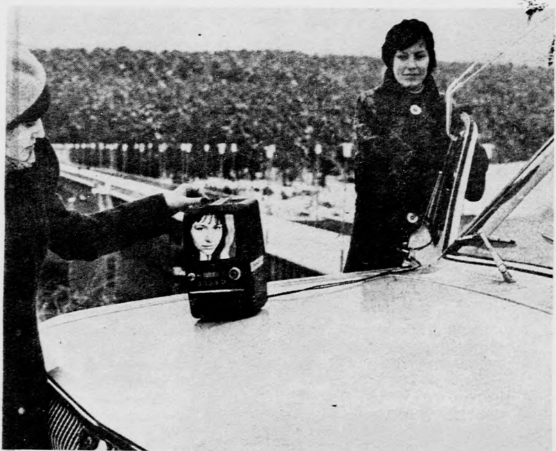
A „Siljálisz” mini tv-t a kaunaszi rádiógyár készíti. Ez az újdonság jó szolgálatot tesz a tengeri és gépkocsis utak kedvelőinek. A képernyő 16 cm. A készülék hálózatról és 12 voltos akkumulátorról egyaránt táplálható. 1978-ban kezdődött a „Siljálisz” tömeges gyártása