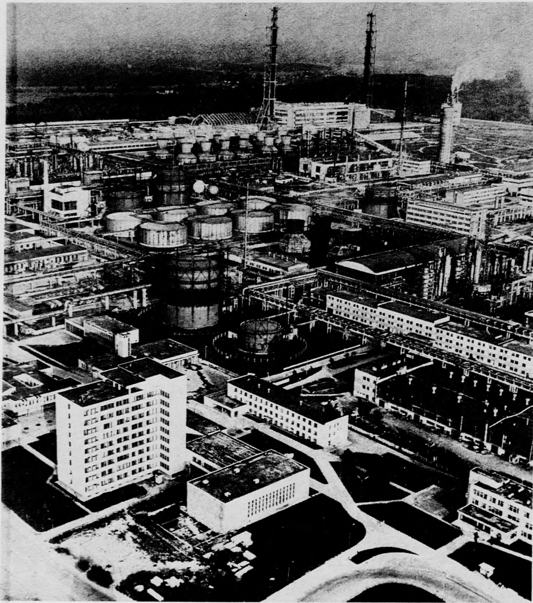
Litvánia nagy vegyüzeme, Litvánia Kommunista Pártjának 60. születésnapját sikeres munkával ünneplik a Jonavi Nitrogénművek építői. Az üzem egyesíti az ammónia, a nitrofoszfát és a salétromsav gyártásának komplex folyamatát. Jelenleg folyik a technológiai berendezés kipróbálása. November 7-re az üzemrészek előállítják az első salétromsav és nitrofoszfát termékeket. A termelés ebben az évben indul be, a határidőnél jelentősen korábban. A felvételen: a Janovi Nitrogénművek látkepe