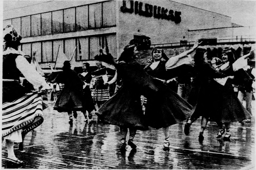
A litván városok utcáin és terein gyakran lehet látni öntevékeny művészegyüttesek szereplését. A felvételen: Klaipéda öntevékeny művészeti együttesének fellépése