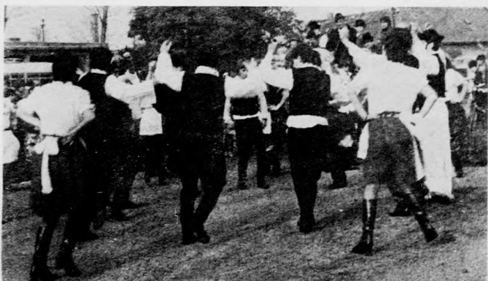
Jó hangulatban, nagy sikerrel tartották meg az idén is a hagyományos szüreti mulatságot Földesen. A táncosok utcahosszat vidám zeneszó mellett hívogatták a falu népét az esti szüreti bála

egyetemi docens lett — azokat a kutatókat és szakembereket tömöríti, akik a politikatudomány valamely ágában kutatásokat folytatnak, illetve ismeretterjesztő munkát végeznek.